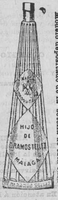
Modelo depositado de la botella de esta casa