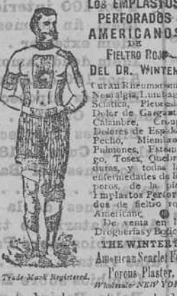
Los EEMPLASTOS PERFORADOS AMERICANOS DEL FIELTRO ROJO DEL DR. WINTER.

Los EEMPLASTOS perforados americanos de fieltro rojo del Dr. WINTER, infunden una saludable corriente eléctrica por todo el sistema, é instantáneamente mitigan los dolores, tranquilizan los nervios, fortalecen los órganos digestivos debilitados y devuelven á los enfermos la salud sin ninguna fè y á menudo á pesar de los temores y las preocupaciones. Estos Emplastos son especial éntes útiles para fortalecer los delicados músculos dorsales de las señoras en sus períodos mensuales. Todas las escuelas de Medicina los reconocen y usan para las curas de las afecciones neurálgicas, reumáticos, debilidad causada por indiscreciones anticipadas esfuerzos indebidos ó enfermades de los riñones, pleurías, calambres, punzadas en la espalda, dolores en el pecho que se extienden á los homoplatos y finalmente para todas las enfermedades que resultan de interrupciones en la circulación.