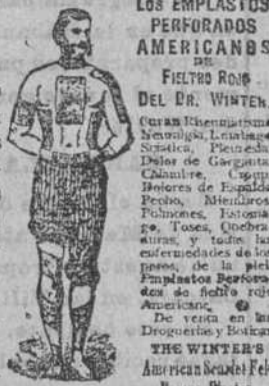
Los EEMPLASTOS PERFORADOS AMERICANOS DEL FIELTRO ROJO DEL DR. WINTER. (Caran) Rheumatism, Neuralgia, Louitige, Sordida, Pleuresia, Dolores de Garganta, Chancres, Capitis, Dolores de Espalda, Reuma, Mialgias, Polmones, Estomago, Toses, Quebraduras, y todas las enfermedades de los nervios, de la piel, Emplastos Perforados de fieltro rojo Americano. De venta en las Droguerías y Boticas THE WINTER'S American Band-Aid. Forous Paste. N.Y. N.Y. U.S.A.

Los EEMPLASTOS perforados americanos de fieltro rojo del Dr. WINTER, infunden una saludable corriente eléctrica por todo el sistema, é instantáneamente mitigan los dolores, tranquilizan los nervios, fortalecen los órganos digestivos debilitados y devuelven á los enfermos la salud sin ninguna fie y á menudo á pesar de los temores y las preocupaciones. Estos Emplastos son especialmente útiles para fortalecer los delicados músculos dorsales de las señoras en sus períodos mensuales. Todas las escuelas de Medicina los recomiendan y usan para las curas de las afecciones neurálgicas, reumatismos, debilidades causadas por indiscreciones anticipadas esfuerzos indebidos ó enfermedades de los riñones, pleuresías, calambres, punzadas en la espalda, dolores en el pecho que se extienden á los homoplastos y finalmente para todas las enfermedades que resultan de interrupción en la circulación.