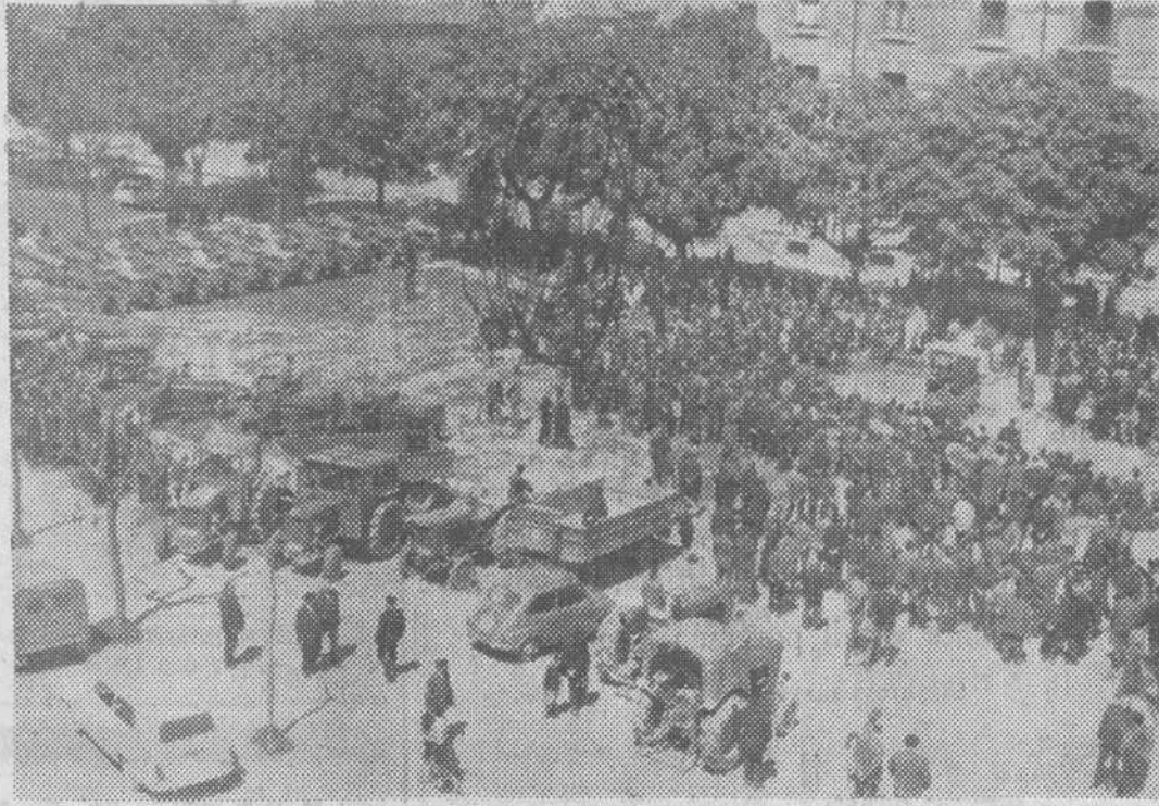
Con el tradicional fervor y brillantéz se conmemoró ayer en Burgos la festividad de San Isidro. El grabado recoge el aspecto que presentaba la explanada existente en la calle de San Agustín, donde fue oficiada una misa de campaña y se hizo la tradicional ofrenda de flores y frutos a la imagen del Santo. — (Foto "Fede").