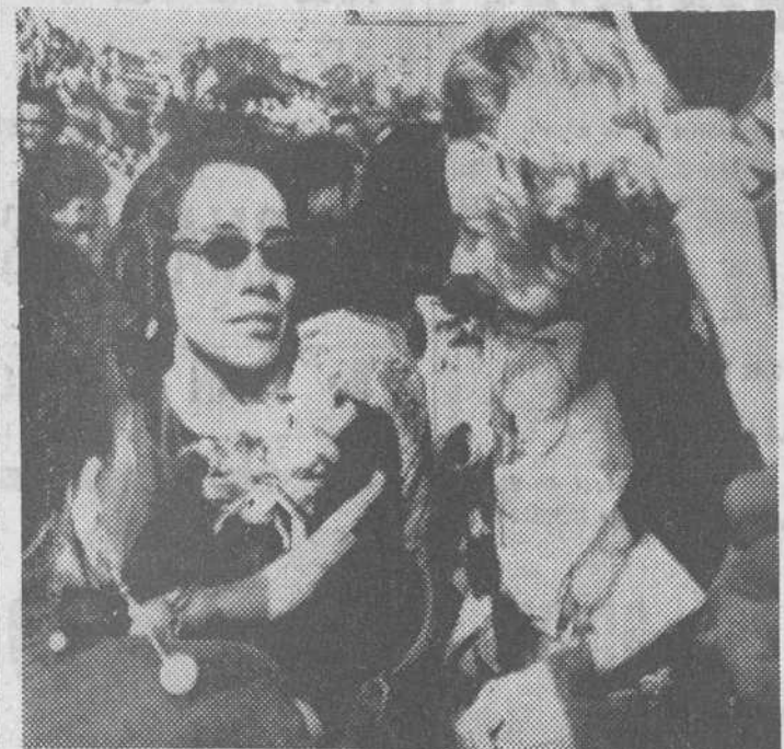
Washington. — La señora de Martin Lutero King Jr. (con gafas oscuras) habla con la esposa de Robert Kennedy durante el rally del día de la madre, para los derechos humanos