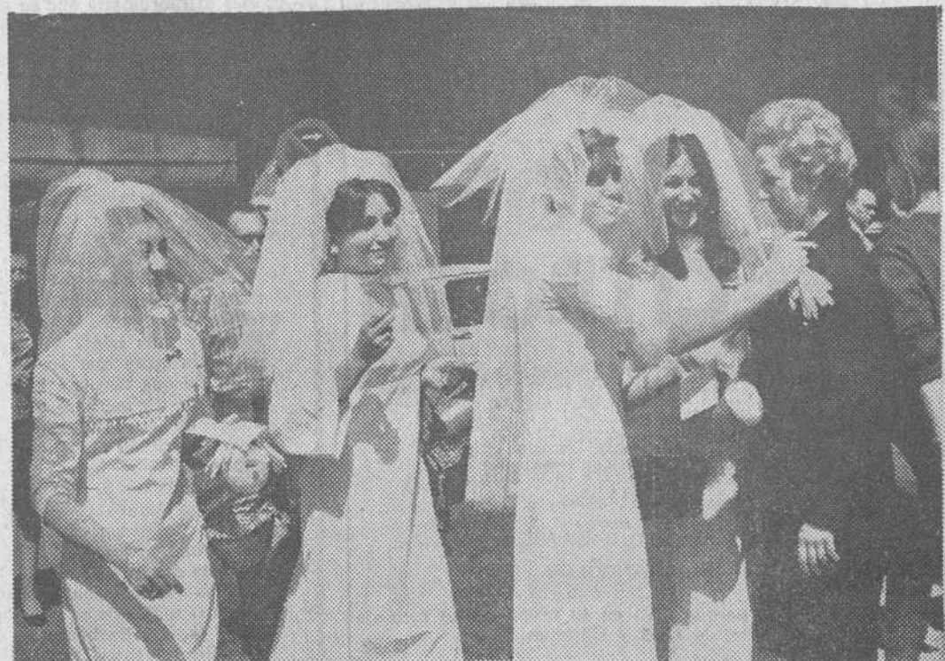
Gran sorpresa en la Gran Vía madrileña durante la cuestación para la Lucha contra el Cáncer. Varias maniqués vistiendo el blanco traje nupcial solicitaban de los transeúntes su donativo. El éxito y la recaudación que obtuvieron fueron extraordinarios.