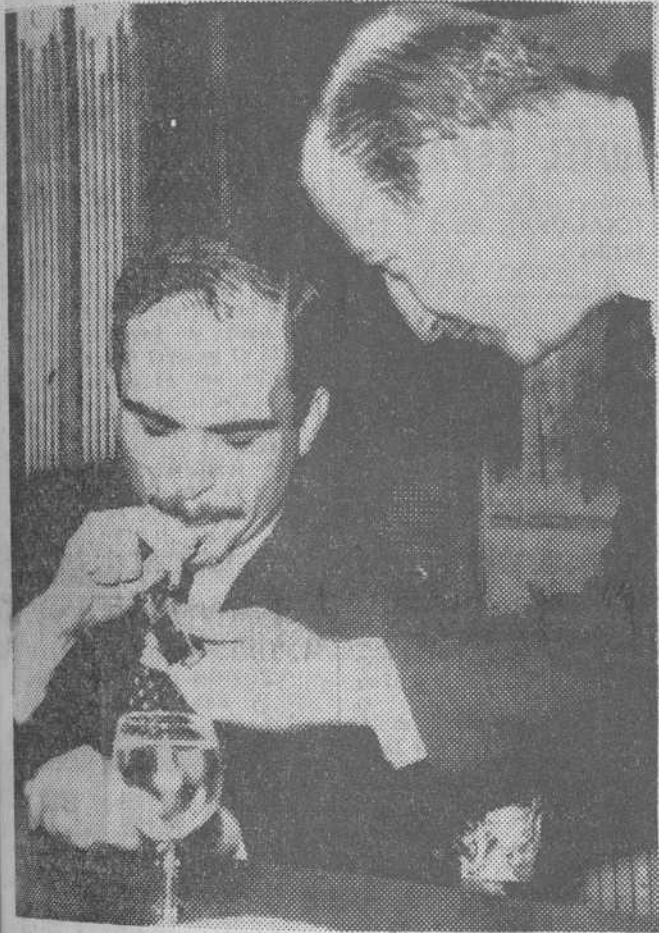
Londres. — Un oficial enciende el cigarrillo al Rey Hussein de Jordania, cuando el último ofreció una conferencia de Prensa al fin de su visita al Reino Unido.