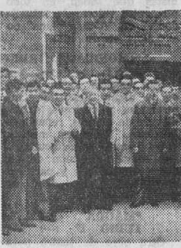
Después de la misa en San Cosme, los asistentes a la fiesta de las Candelas...