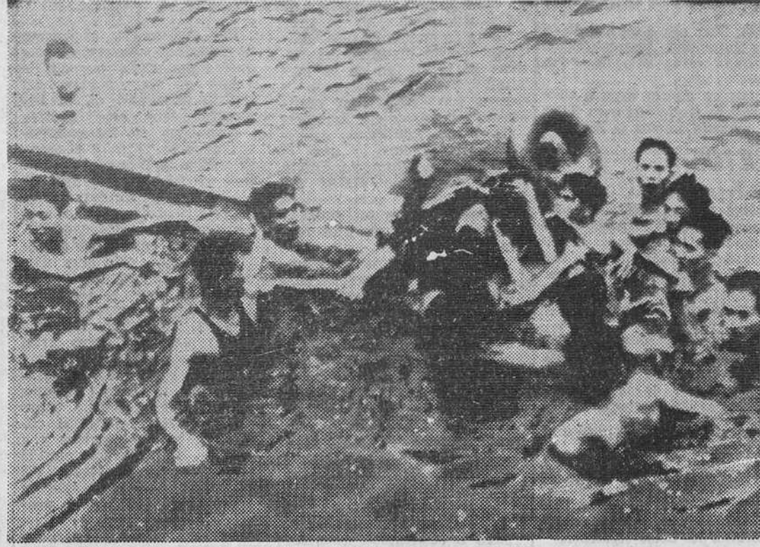
Esta fotografía recoge el momento de rescatar de las aguas del lago Bach True, cerca de Hanoi, el cuerpo de John Sidney Mac Cain. Su avión fue alcanzado cuando realizaba una incursión sobre la capital del Vietnam del Norte.

A mi regreso a Francia tuve ocasión de hablar de los terribles bombardeos a los norteamericanos con algunos de los que se dijeron posibles. — ¿Cómo es posible — les dije — que digan ustedes que no atacan más que objetivos militares? ¿Desde cuándo se destruyen los puentes con cañicas? Diálogo de sordos. Por otra parte, he sido también en Hanoi donde me he encontrado con los norteamericanos. Pilotos hechos prisioneros, pilotos heridos, con frecuencia, al hacer funcionar su asiento proyectable. Los norteamericanos, al igual que los vietnamitas a quienes ellos matan, aunque no por las mismas razones, no entienden lo que les ha sucedido. He aquí algunos ejemplos de su manera de pensar.