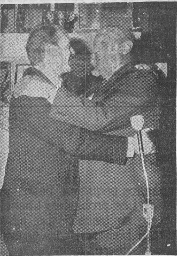
Santiago Bernabéu y Alfredo Di Stefano, eternos amigos a pesar de los pesares, se abrazan el día del partido homenaje.

De jugada perdida se puede calificar el fichaje por el Club Deportivo Español de Barcelona de Alfredo Di Stefano, porque la realidad es que fue un fracaso. Un jugador de esta categoría no debió nunca haber tal cosa. Al menos, a piensas toda la acción. Pero vuelve a surgir el temperamento de Di Stefano. Quería demostrar a toda costa que estaba en perfectas condiciones de continuar jugando al fútbol. No le interesaban los millones porque los tenía. Al sa del Madrid, el Club le hizo entrega de dos millones de pesetas como anticipo del homenaje que quedaba pendiente. Tampoco podía poner por medio su afición, porque siempre se pue-