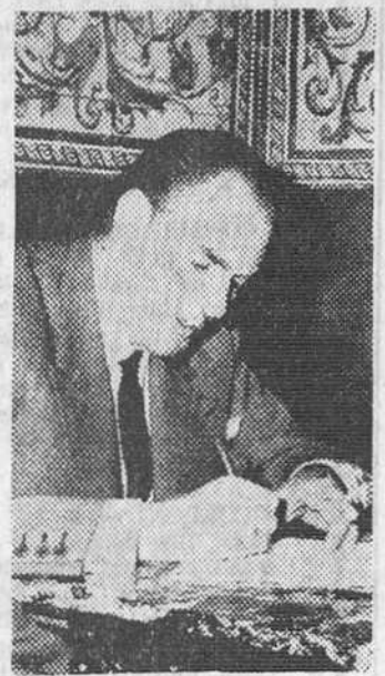
Madrid. — Fotografía del famoso periodista burgalés Santiago Córdoba, que ha fallecido en Madrid. — (Foto CIFRA)

desarrollo supone inferioridad en orden a las características del diálogo. Sólo en el caso de concertarse un acuerdo más amplio, que incluyese aspectos no estrictamente comerciales (colaboraciones, ayudas técnicas y financieras, mano de obra y otras) podrían admitirse las cargas comerciales que entraña el acuerdo, hecho que no posee el