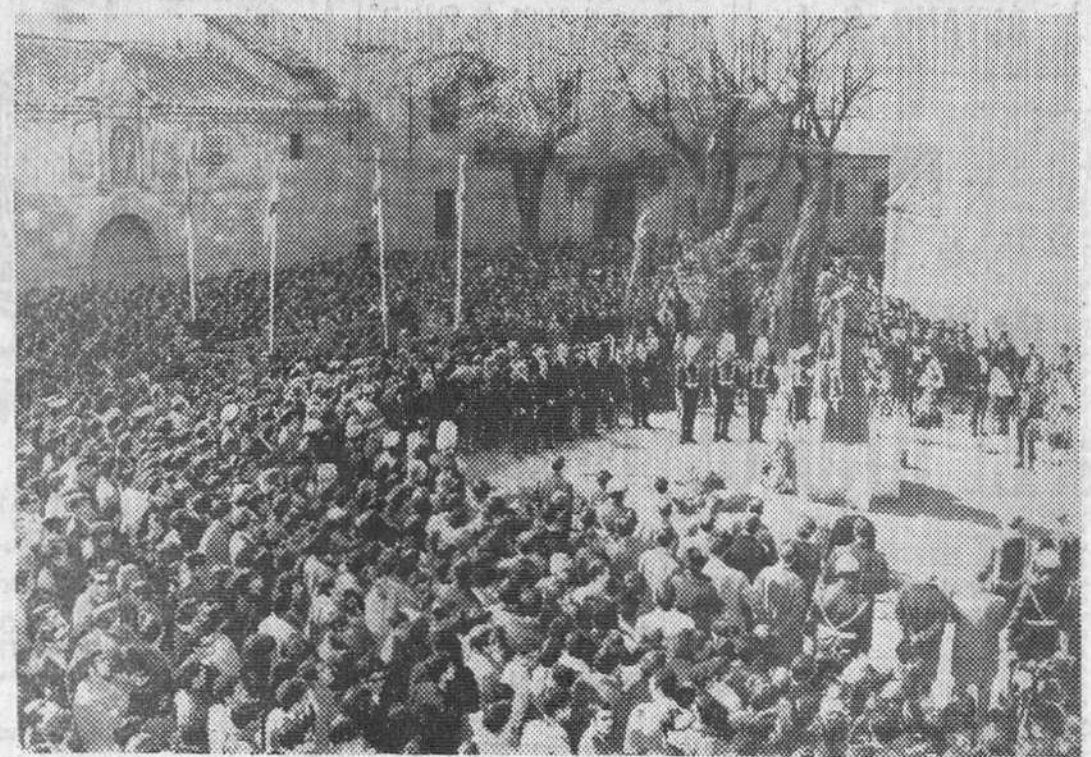
En la Plaza de las Ursulas de Salamanca se ha inaugurado un monumento al inmortal escritor y rector de la Universidad salmantina don Miguel de Unamuno, constituyendo el acto un gran homenaje popular, como puede verse en esta fotografía que recoge el momento del descubrimiento de la estatua.