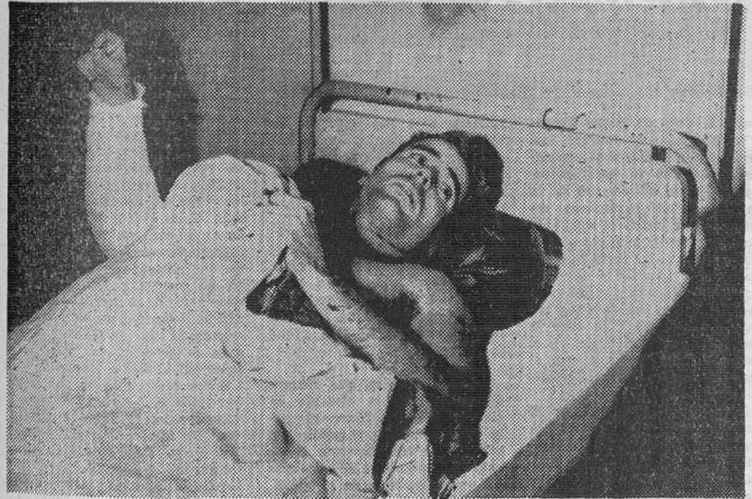
Este es John Sidney Mac Cain, piloto norteamericano, hijo del comandante en jefe de las fuerzas USA en Europa. Convalace en un hospital de Hanoi.

Próximo capítulo: LAS BOMBAS QUE HACEN ESTALLAR LOS CUERPOS