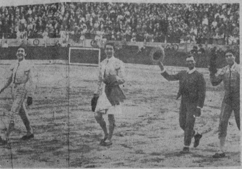
Apoteosis de la memorable corrida de ayer en la centenaria plaza burgalesa. Los tres espadas, con el mayoral de la vacada de don Felipe Bartolomé, dan la vuelta al ruedo, entre las aclamaciones clamorosas de la muchedumbre.

la espada y señaló un pinchazo arriba y, a seguido, cobró media estocada superior en lo alto, poniendo epílogo a su memorable faena con la espada de cruzeta. Ovación enorme, dos orejas y vuelta al ruedo. Al toro se le aplaude en el arrastre.