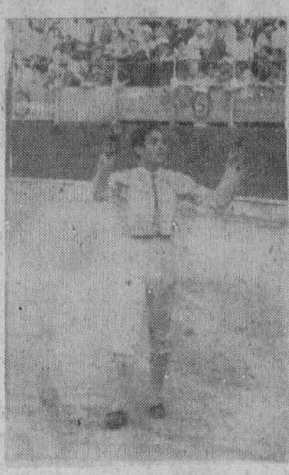
Paco Camino, el exquisito torero de Camas, corresponde a las aclamaciones del público, con las dos orejas del último de la tarde, tras su triunfal actuación de ayer tarde

Salta a la arena el tercero, número 62, de nombre "Tejón", cárdano y claro y con 467 kilos en la báscula. Paco Camino lancea superiormente a la verónica, abriendo el compás y bajando las manos, para cargar la suerte a la perfección, rematando con media superior. (Olés y aplausos). El toro, que es muy bravo, se arranca de largo a las plazas montadas y acepta una vara buena de Lausín, empujando con fuerza bajo el peto. Al quite, Camino, por chiclelinas de mucho aprieto, que provocan olés y aplausos. Pide el de Camas cambio de suerte y Ferrer y Chapi parean en menos que lo cuento. Brindis al conclave. Dobladitas eficaces por bajo, para traer a mandamiento al de Bartolomé, que está superior para la muleta. Cita de lejos el maestro y engarza tres derechazos torerísimos, ce-