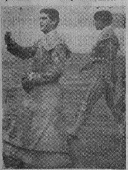
El bravo torero burgalés, Rafael Pedrosa, satisfecho de su triunfo clamoroso, muestra las dos orejas y el rabo de su segundo toro

En el paseíllo ya comenzaron a sonar los aplausos —que habían de prolongarse y acrecentarse durante toda la tarde— para los tres diestros que integran el cartel. El ambiente era propicio para la diversión y el triunfo.