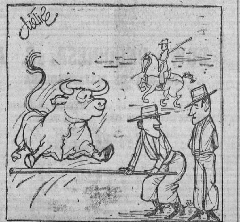
—Les enseño porque luego al público lo que le gusta es verlo saltar la barrera.