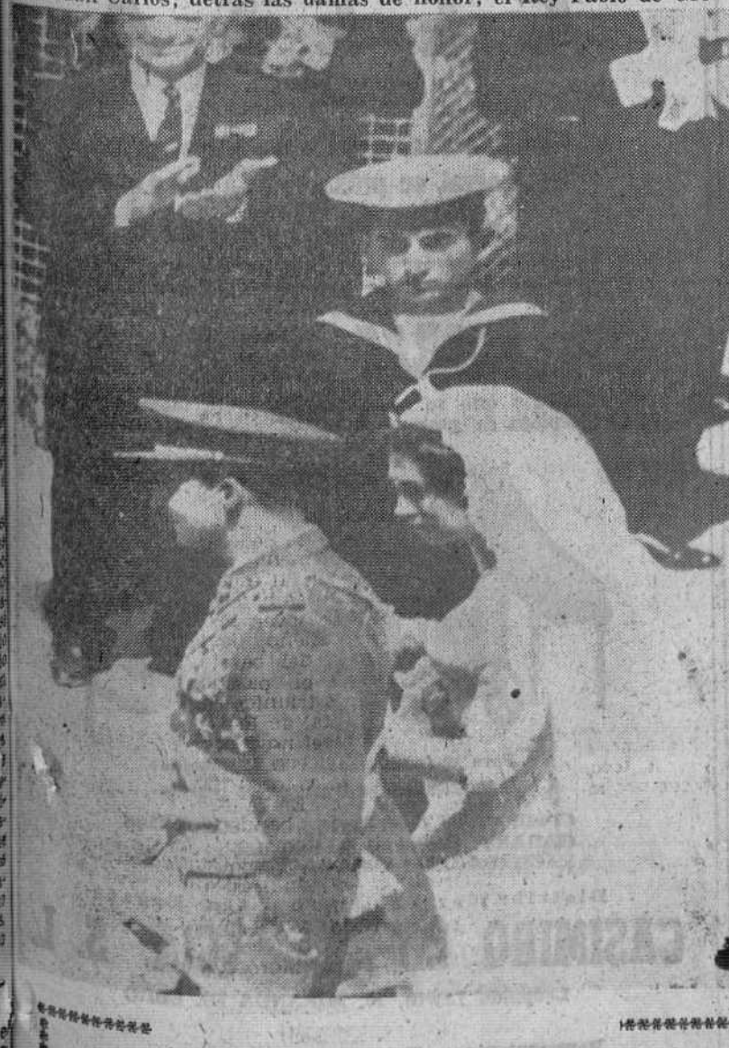
ATENAS. — Centenares de miles de personas siguieron por las calles de la capital de Grecia el paso de la brillantísima comitiva nupcial hacia la Catedral ateniense de San Dionisio. — En el precedente grabado, los novios, a la salida del templo, son aclamados por la multitud. Junto a la egregia pareja se observa la presencia de un marino del «Canarias», formado junto a la Catedral, rindiendo honores. — (Telefoto Europa Press).

La ceremonia duró 40 minutos. Los novios se volvieron hacia los invitados. La Princesa Sofía iba del brazo de S. A. R. el Príncipe Don Juan Carlos; detrás las damas de honor; el Rey Pablo de Grecia.