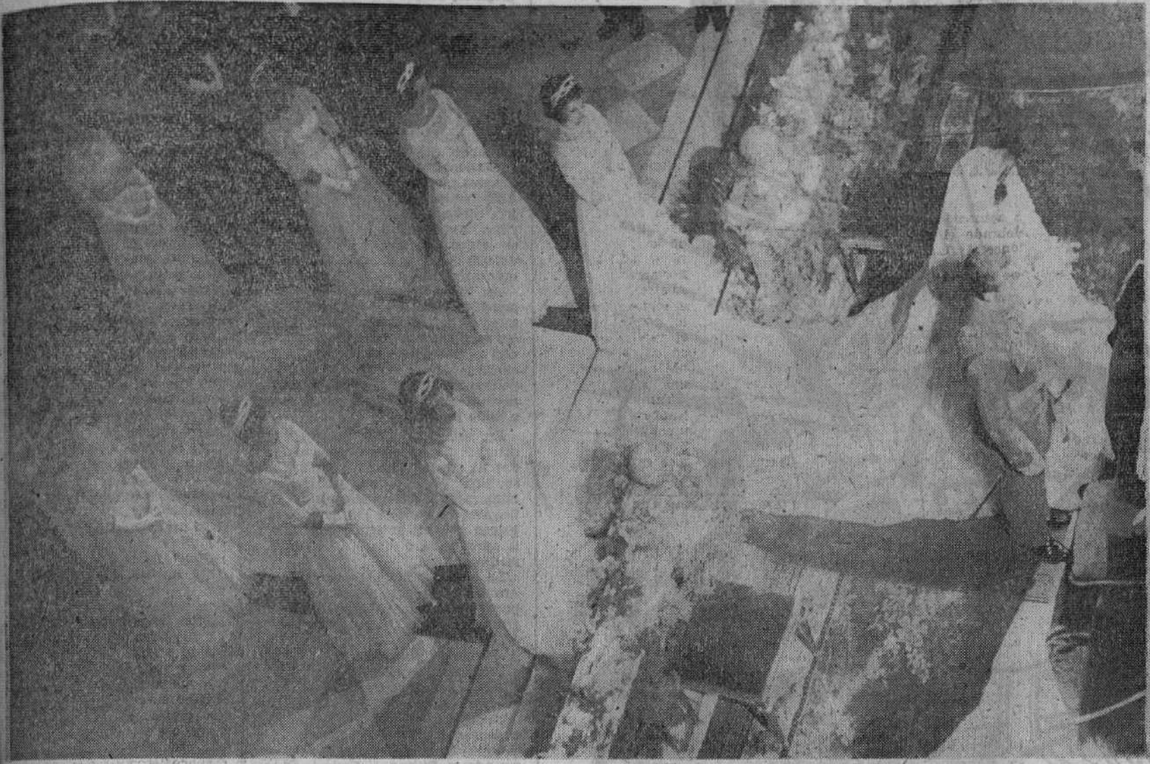
ATENAS. — UN MOMENTO DE LA SOLEMNE CEREMONIA NUPCIAL. — LA FELIZ PAREJA APARECE ANTE EL ALTAR, RODEADA POR LAS OCHO PRINCESAS QUE COMPONIAN LA CORTE DE HONOR DE LA DESPOSADA. — (Telefoto Europa Press).

Una anciana sefardita que quiso ver de cerca "la boda de su amado Príncipe" falleció a causa de la emoción