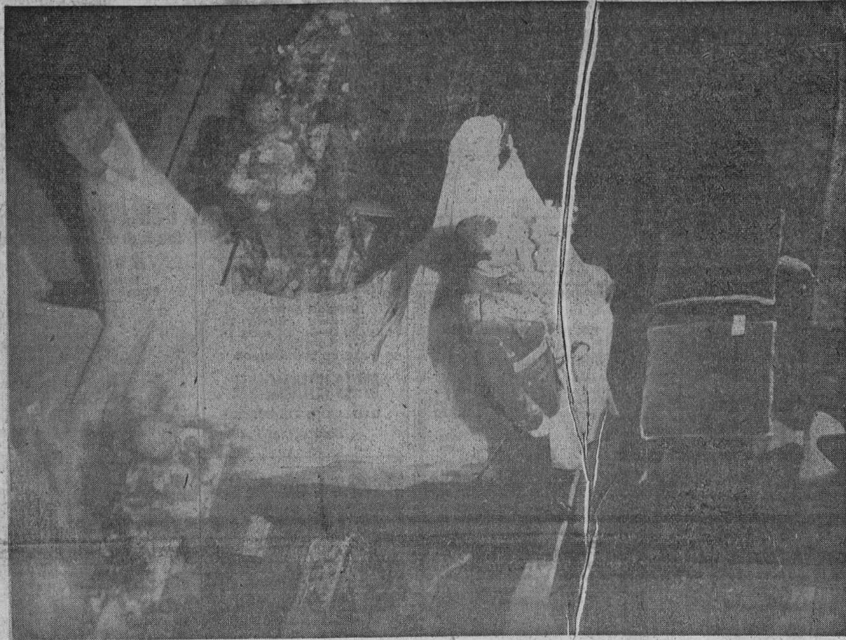
DIARIO DE BURGOS se complace en ofrecer hoy a sus lectores un extraordinario servicio gráfico e informativo, del gran acontecimiento que tuvo ayer por marco la capital de Grecia. Nuestro periódico, sin regatear medios ni desembolsos económicos, contrató con la gran Agencia de Prensa nacional y extranjera "Europa Press", con carácter de exclusiva para Burgos, un servicio gráfico de urgencia, del fausto suceso real de ayer, para lograr el cual "Europa Press" fletó particularmente un avión especial, que trasladó desde Atenas a Madrid los documentos gráficos más señalados del enlace matrimonial entre la Princesa Sofía de Grecia y el Príncipe Juan Carlos de Borbón. Estas fotografías, que ilustran el presente número, estaban en nuestro poder, ayer a primera hora de la noche, batiendo un auténtico récord de transmisión en la historia del periodismo burgalés. En el precedente grabado, la augusta pareja, ante el altar de la Catedral de San Dionisio, donde se celebró su enlace. (En páginas interiores ofrecemos otros cuatro documentos gráficos de la ceremonia nupcial de ayer en Atenas.)

Al subir las escalinatas de la Iglesia de San Dionisio, la Princesa (Pasa a quinta página)