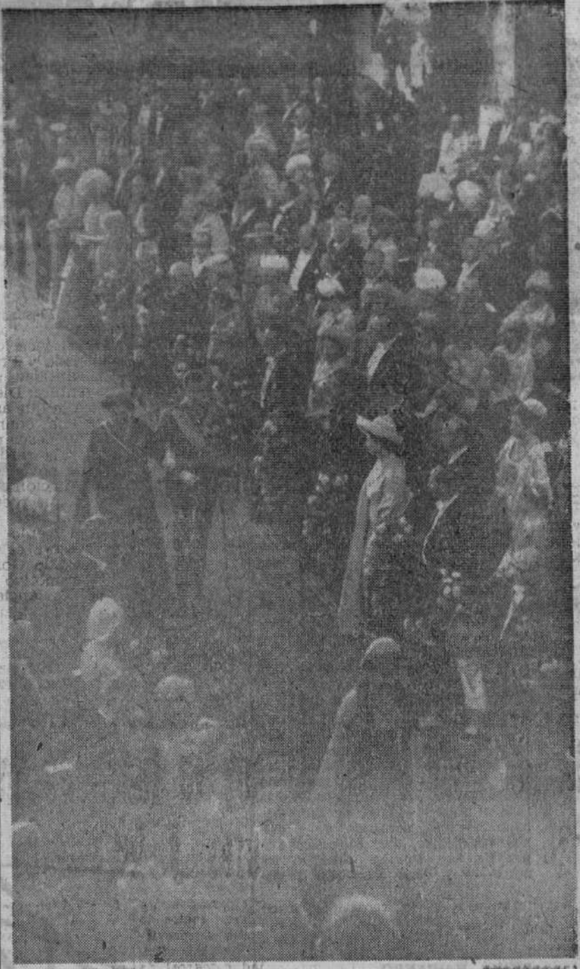
Atenas.—La comitiva nupcial, a su entrada en el templo de San Dionisio. — El novio, Príncipe D. Juan Carlos, avanza hacia el altar, acompañado de su augusta madre. Ante ellos marcha el Conde de Barcelona, dando el brazo a la Reina Federica de Grecia.

Indudablemente, el pueblo griego se siente satisfecho ante esta boda de su Princesa Sofía con un Príncipe español. Grecia admira, desde luego a España, a la que reconoce las virtudes del heroísmo, la nobleza y el ingenio, al mismo tiempo que se da entre españoles y griegos una comprensión rápida. En el momento en que las salvas de artillería anunciaban la conclusión de las ceremonias, los griegos estrechaban sus manos con los españoles, deseando felicidad a los Príncipes, en esta espléndida jornada de amistad hispanogriega, a la sombra de la imponente Acrópolis.