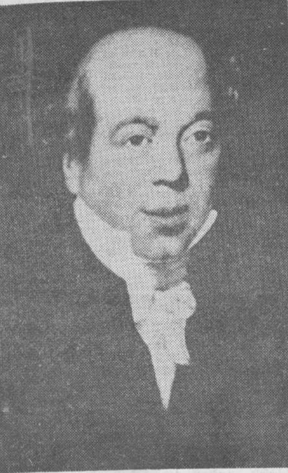
Nathan, barón de Rothschild, tercer hijo de Meyer.

Cuando más seguro parecía el imperio napoleónico en Europa, el pueblo español se levantó en armas. El ejército francés, llegado a España, Inglaterra, envió a un emisario al mando de Wellington. El principal problema con que se enfrentaba el general inglés estribaba en pagar a sus tropas. Su Majestad eran frecuentemente hundidos por los gastos de guerra. Los soldados eran pagados por el Tesoro británico. El emisario era un hombre de confianza que cuando los títulos conseguían llegar a España se pagaban a muy bajo precio, para que los intermediarios pudieran tener su ganancia al ser pagados su valor en Londres. Natan vio con absoluta claridad que el negocio se encontraba en una sola mano las ganancias serían fabulosas. Y rápidamente organizó una cadena de agentes que iban a comprar los títulos emitidos por Wellington que se dirigían hacia París. De allí bajaba Salomón cargado de títulos y