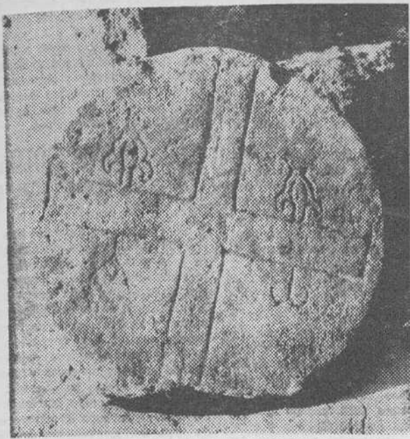
Reverso de la estela.