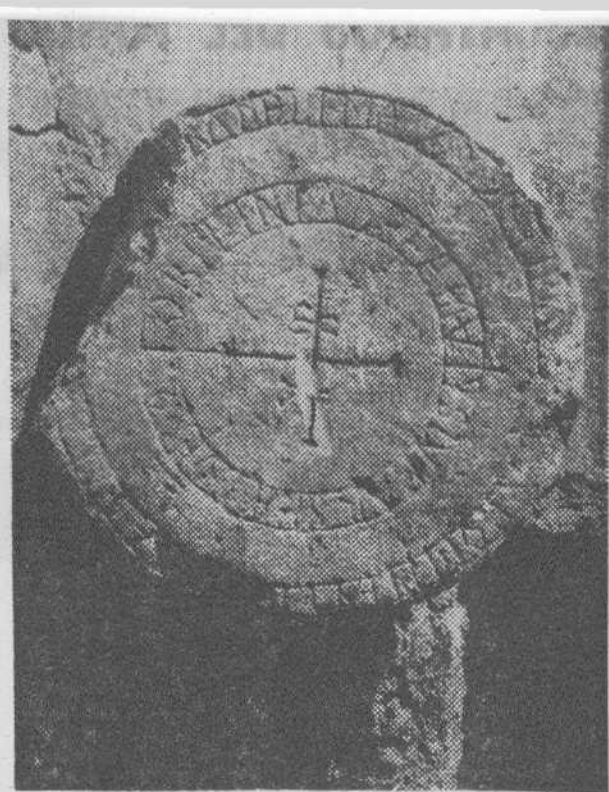
Anverso de la estela.

Por fin añadiremos que esta época es una de las más oscuras de nuestra Historia española debido a la falta de documentos, que son en realidad los que constituyen el andamiaje de apoyo que sirve para poner en pie algo vivo; de aquí lo interesante de los hallazgos arqueológicos de aquellas remotas centurias. No olvidemos que la historia es algo que aburre cuando no se vive y se vibra con su sentido que glorificó el pasado, anima el presente e ilustra el porvenir.