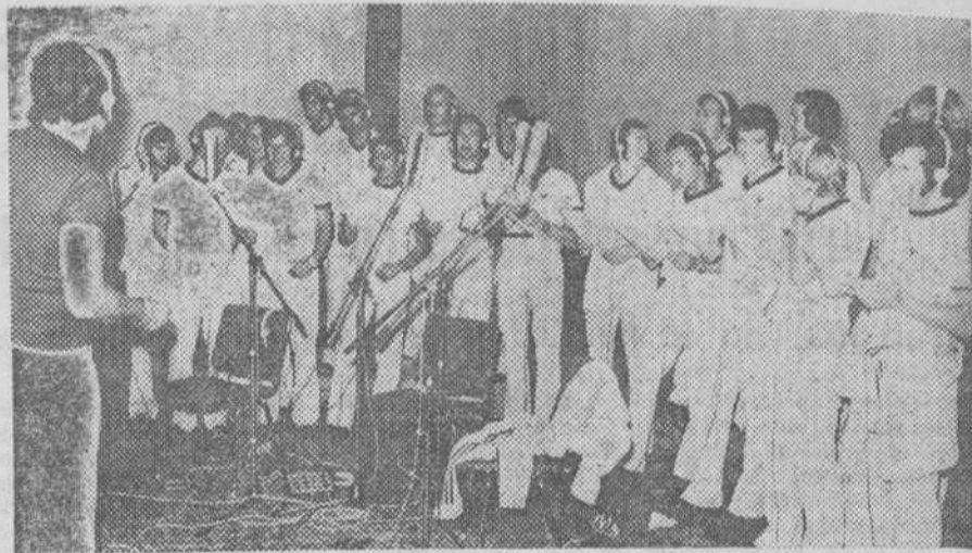
Siguiendo el ejemplo del equipo inglés, la selección alemana de fútbol acaba de grabar un disco. Los beneficios obtenidos serán destinados a la UNICEF y a la promoción de nuevos valores de este deporte. Del disco de los ingleses se vendieron nada menos que 2,3 millones de ejemplares, más que del mejor de los Beatles. Del de los alemanes, que lleva por título «Jugando al fútbol en nuestra vida», se hará para empezar una tirada de 250.000. En esta foto vemos a los futbolistas alemanes durante la grabación en unos estudios de Walldorf, cerca de Frankfurt.