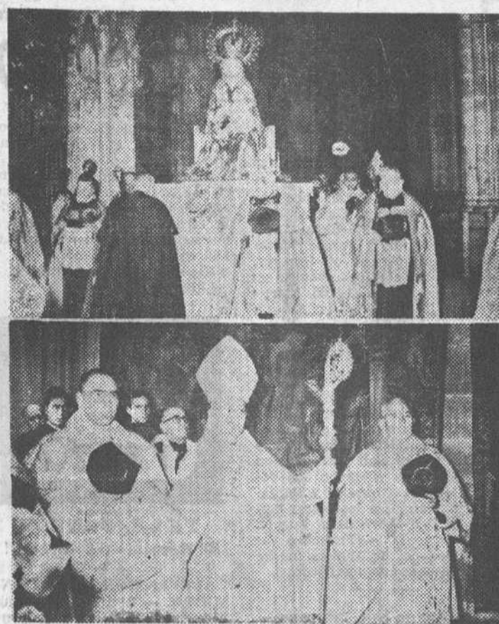
Con el tradicional fervor y la misma solemnidad de años anteriores, se celebró el domingo, en la S. I. C., la fiesta de la Asunción de Nuestra Señora, patrona de la ciudad y la diócesis. En nuestro grabado, dos momentos de la procesión claustral.