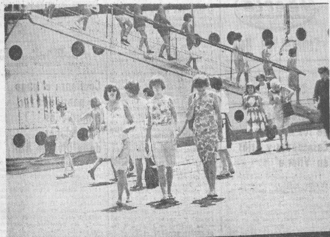
Pese a los "consejos" de ciertos políticos de su país, los turistas ingleses siguen afuyendo a todos los puertos y aeropuertos españoles. En la foto, los mil pasajeros del "Devonia" desembarcando en los muelles de La Coruña.