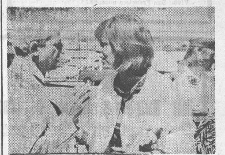
Madrid. — Ha llegado al aeropuerto de Barajas la actriz cinematográfica griega Melina Mercuri, recién terminado su trabajo en el filme «americano» que se rodó en Italia. En España protagonizará una película que dirigirá su marido, Jules Dassin. Melina llegó con un perro caniche y bajó sonriendo del avión, saludando a una nube de fotógrafos. E abrazada por su marido y poco después hizo las primeras declaraciones para la prensa. Los compañeros de reparto de Melina en la película que rodará aquí serán Romy Schneider, Peter Finch y el español Julián Mateos. Se llama la película «A las 10,30 de una noche de verano». — En la foto, los esposos charlan después de la llegada de la actriz.