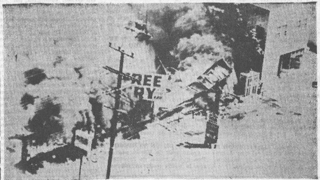
Los Angeles. — He aquí tres edificios en llamas, incendios provocados por los negros en el marco de los disturbios registrados en la historia de Los Angeles. El gobernador ha ordenado acudir a la Guardia Nacional para poner fin a los desórdenes.