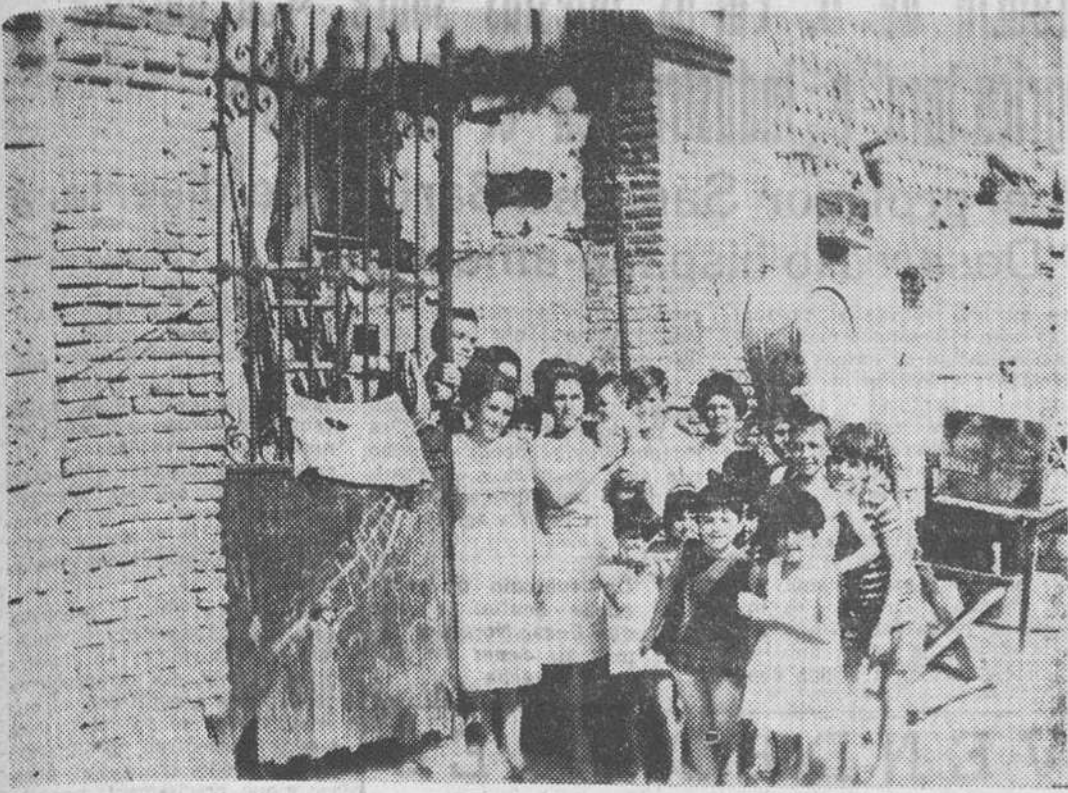
Una nueva casa madrileña va a ser desalojada, dejando a sus vecinos en la calle. Esta vez se halla en Banco de la Unión núm. 2, a muy pocos metros de la Avenida del Generalísimo. Los inquilinos —catorce familias— nunca han conocido al propietario, ya que entraron a vivir estando la casa abandonada. Si el problema no se soluciona, los vecinos tendrán que abandonar sus viviendas en un plazo máximo de ocho días. — (Hispania Press).