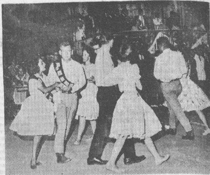
Con asistencia del primer secretario de la Embajada de los Estados Unidos y de otras personalidades españolas y americanas, se ha celebrado en el parque de Las Vistillas la "Noche de América". La banda de la XVI Fuerza Aérea interpretó un concierto y estrenó el chotis "Quermés" de Las Vistillas. Después, el grupo de baile de las fuerzas interpretó diversas piezas típicas del Oeste americano.