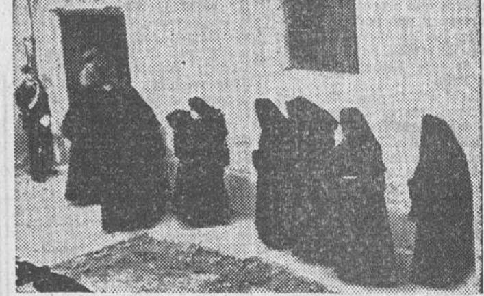
Las monjas de un convento de Roma entran en hilera en uno de los colegios electorales durante las recientes elecciones municipales en las que comunistas y socialistas han tenido un importante avance a costa de democristianos y partidos del centro

El mensaje del presidente Johnson fue enviado a todos los que se encuentran al servicio de la administración inclusive fuera del país, por medio de los satélites "Syncon" y "Relay".