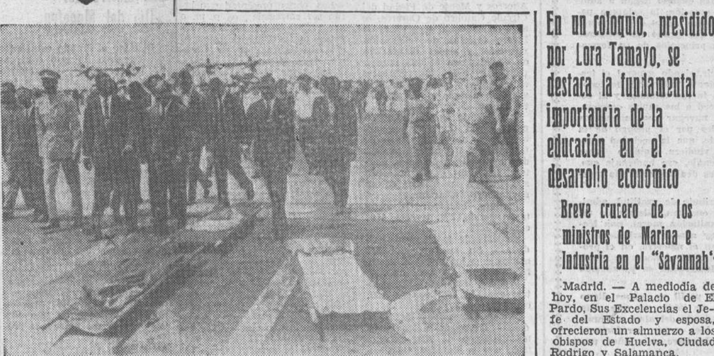
Leopoldville.—Con los miembros de su Gobierno, Moises Tshombe (a la izquierda en traje de paisano, al lado de un oficial) llega al aeropuerto de Leopoldville para recibir a los primeros rehenes blancos liberados por los paracaidistas belgas de manos de los rebeldes congoleños en Stanleyville.