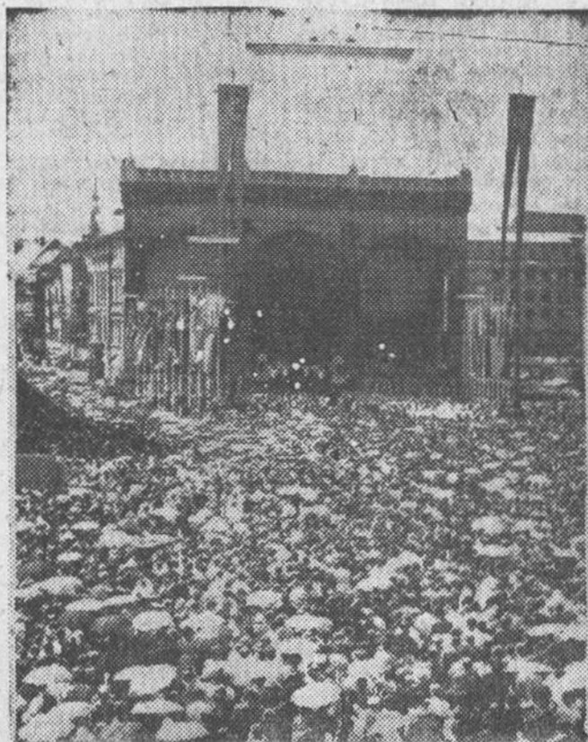
Acto de inauguración del Congreso Eucarístico Internacional de Munich, en 1960, último de los celebrados hasta ahora. El Cardenal Wendel, arzobispo de la capital bávara, oficia la misa de pontifical.

En Madrid, y en 1911, se celebró el 22 Congreso Eucarístico Internacional. Presidió como Legado Pontificio el Cardenal Aguirre, arzobispo de Toledo. Su nota característica fue el fervor y el entusiasmo sobrepasado de las muchedumbres que asistieron a él, en contraste con el ambiente oficial, poco propicio a estas manifestaciones de religiosidad. No hay que olvidar que gobernaba entonces don José Canalejas, quien impulsaba una política laica y anticlerical, las relaciones con Roma se hallaban entonces en un punto de gran tensión, y la aprobación