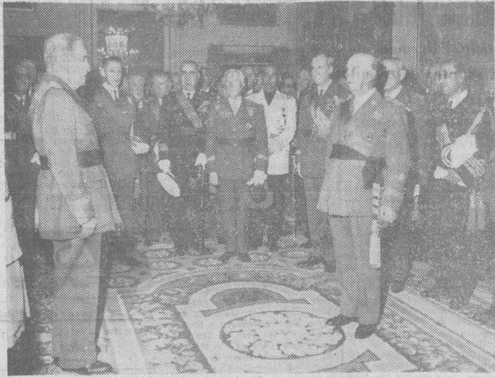
Madrid. — S. E. el Jefe del Estado, Generalísimo Franco, recibió en el Palacio de El Pardo a los jefes y oficiales del Ejército de Tierra, Mar y Aire, pronunciando unas palabras del vicepresidente del Gobierno y capitán general, Muñoz Grandes, reitera ndole su inquebrantable adhesión.