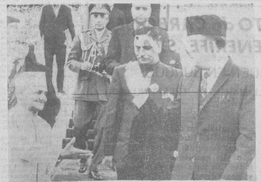
Tashkent. — El premier de la India, Shastri, izqui erda, y el presidente de Pakistán, Ayub Jan, de recha, vistos durante su entrevista de ayer, aquí.