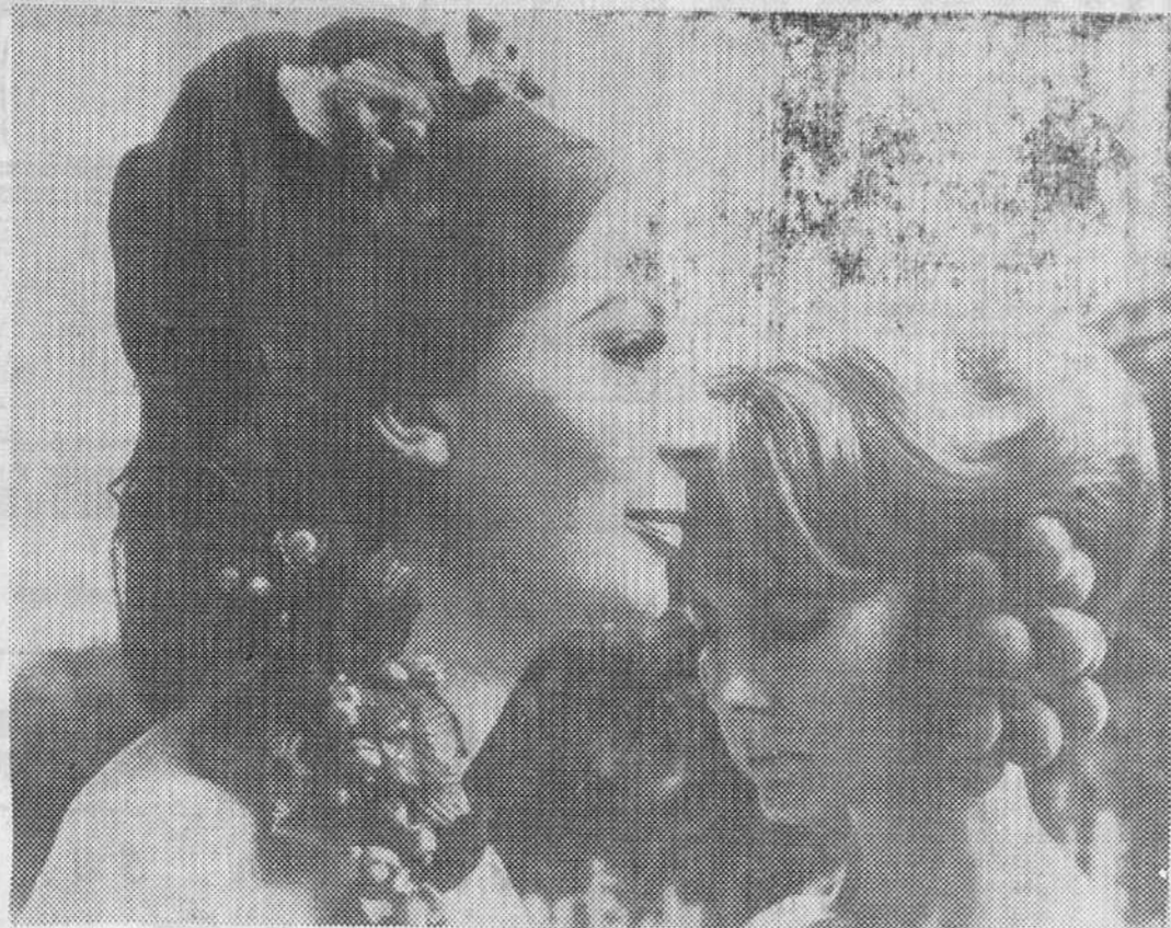
Los grandes peluqueros parisinos han presentado la línea de la nueva tendencia para el otoño. Está basada, principalmente, en la recolección de la fruta y aquí vemos dos modelos de peinados de esta tendencia.

ba cuenta de que era más interesante al público la de dos piernas que la de cuatro ruedas.