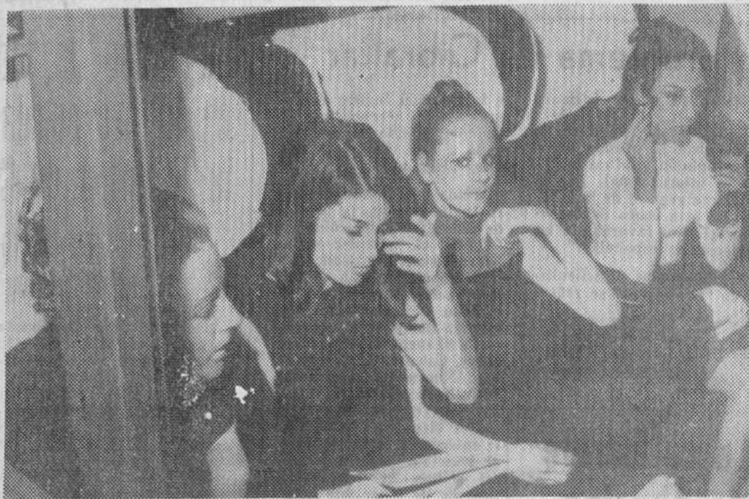
Cuatro maniqués de la «cábina» de Saint-Laurent vestidas con modelos de la modista, peinadas por Bruno y maquilladas por ellas mismas, en el compartimento del tren. — (Foto CIFRA).

MUCHAS personas se burlan de las maniqués diciendo que su vocación podría resumirse en el viejo adagio: Sé bella y cállate. Por el momento, se trata de jóve-