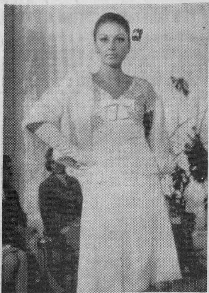
El salón de alta costura Faschingbauer de Viena acaba de presentar su colección de otoño-invierno. He aquí un vestido de «cocktail» denominado «Geraldine». Se complementa con una chaquetilla de piel.