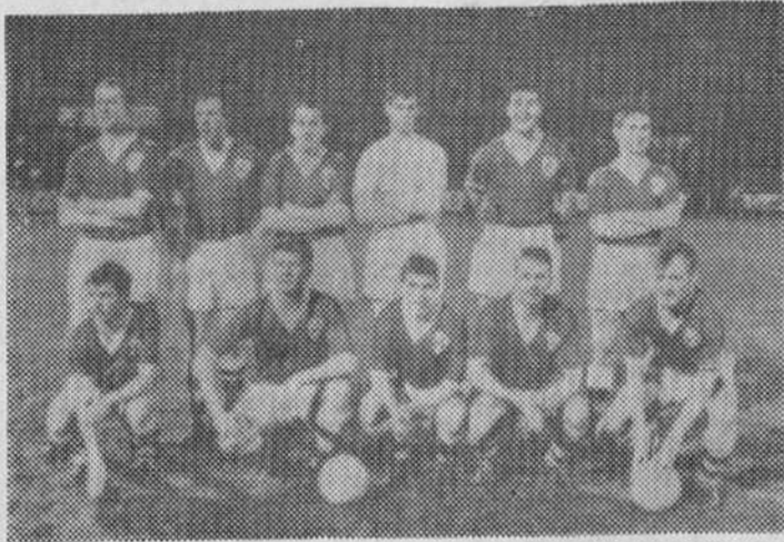
El equipo del Eire que jugó últimamente con España. Algunos de estos hombres se alinearán también en el partido del próximo domingo.

Lo que sí puede exponer el crítico es que España ha sido en el conjunto muy superior a Eire, a través de 34 años y medio, en 13 cotejos, con un índice de