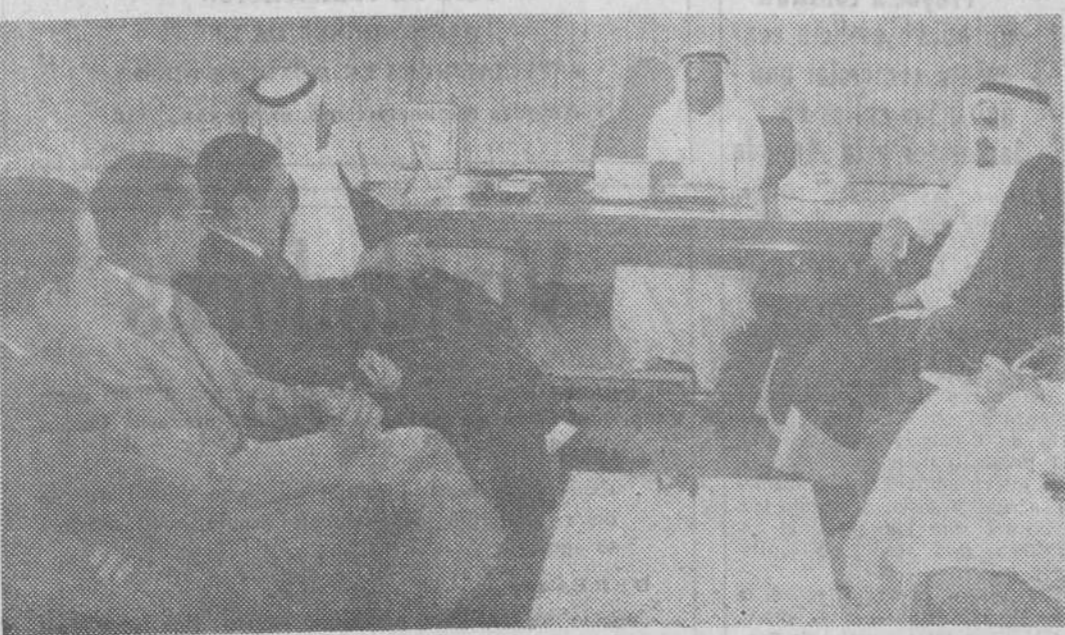
Jeddah (Arabia Saudí). — El señor López Bravo y las personalidades de su séquito durante su visita a las instalaciones de la fábrica de cementos «Cementco», en las afueras de Jeddah, a orillas del Mar Rojo. En el despacho del director de dicha fábrica celebró una entrevista con el personal directivo de la misma, representantes de la Cámara de Comercio, Prensa y TV locales.