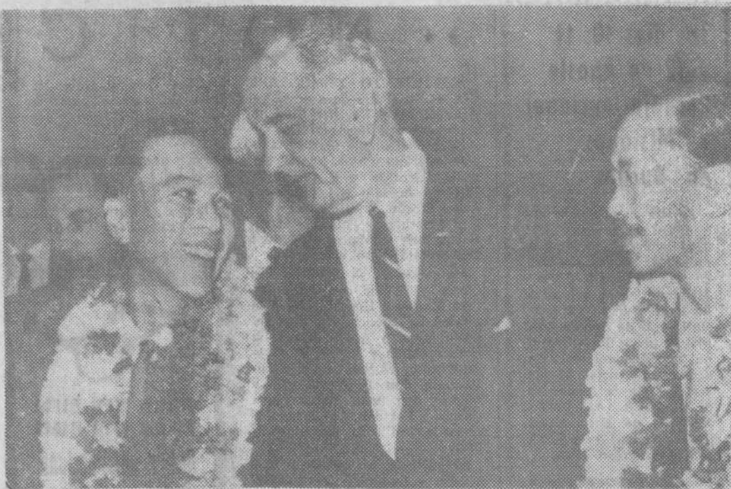
Honolulu. — Comienzo de las reuniones de alto nivel entre los líderes de Estados Unidos y Vietnam del Sur. En la fotografía, de izquierda a derecha, Nguyen Van Thieu, jefe del Estado survietnamita; el presidente Johnson y Nguyen Cao Ky, jefe del Gobierno de Vietnam del Sur.

En carta a otros países pide ayuda para detener la agresión de EE. UU.