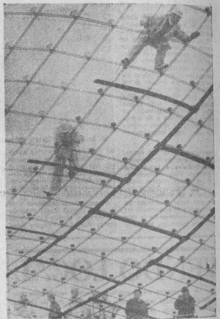
En Munich (Alemania), donde se celebrarán los Juegos Olímpicos de 1972, se están ensayando actualmente las clases de tejados o cubiertas para el gran estadio olímpico. En esta foto vemos cómo se instala un segmento de 200 metros cuadrados. Se efectuarán mediciones de oscilación para los cálculos estáticos, se analizará la permeabilidad a la luz del material y se harán experimentos con telas de plástico, otras de poliéster y otras de vidrio acrílico. Dentro de unos dos meses se conocerá la decisión sobre el material a adoptar para el tejado de 75.000 metros cuadrados.

¿Qué significa todo esto para Munich? Según los planes iniciales, la capital de Baviera tenía que aportar 180 millones de marcos del total de 520 millones. Con las nuevas modificaciones, esta cantidad se elevaría a 215 millones de marcos, lo que es verdaderamente elevado. Por esta causa, se han llevado a cabo negociaciones a diversos niveles gracias a las cuales la participación de Munich se elevaría en definitiva a unos 175 millones de marcos, con lo que nos situaríamos muy