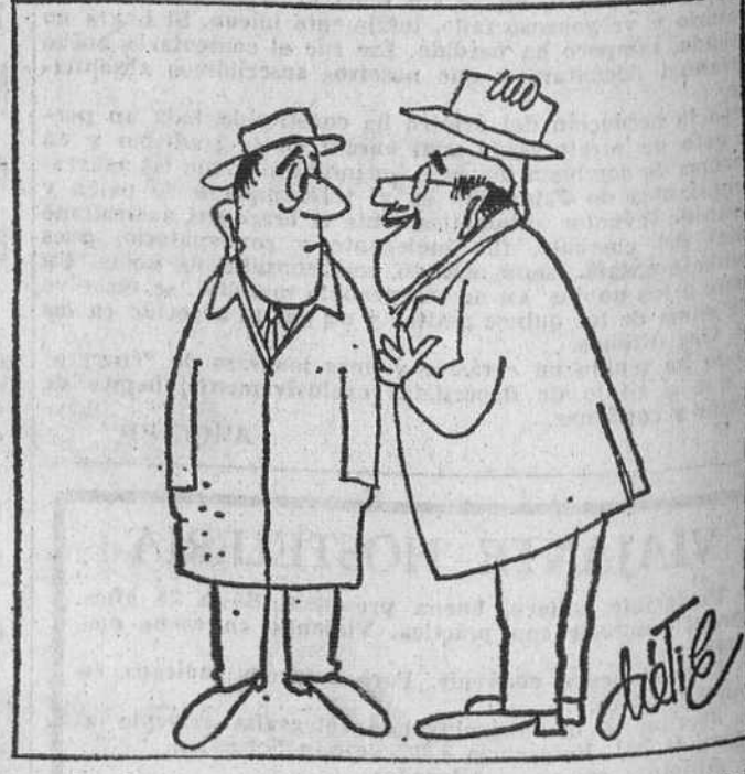
—Caballero, yo soy partidario de la violencia, ¿me permite que le vea?

Se desarrolla la escena en un restaurante. El cliente llama al camarero y le dice: — En la nota que me acaba usted de traer hay dos errores: uno a favor de la casa y el otro a mi o. El camarero, visiblemente sorprendido, exclama: — ¿A su favor? ¿Dónde está eso?