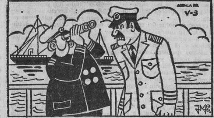
Estos dos dibujos son aparentemente iguales. Siete diferencias los separan. Si es usted buen observador, debe descubrirlos antes de cinco minutos.