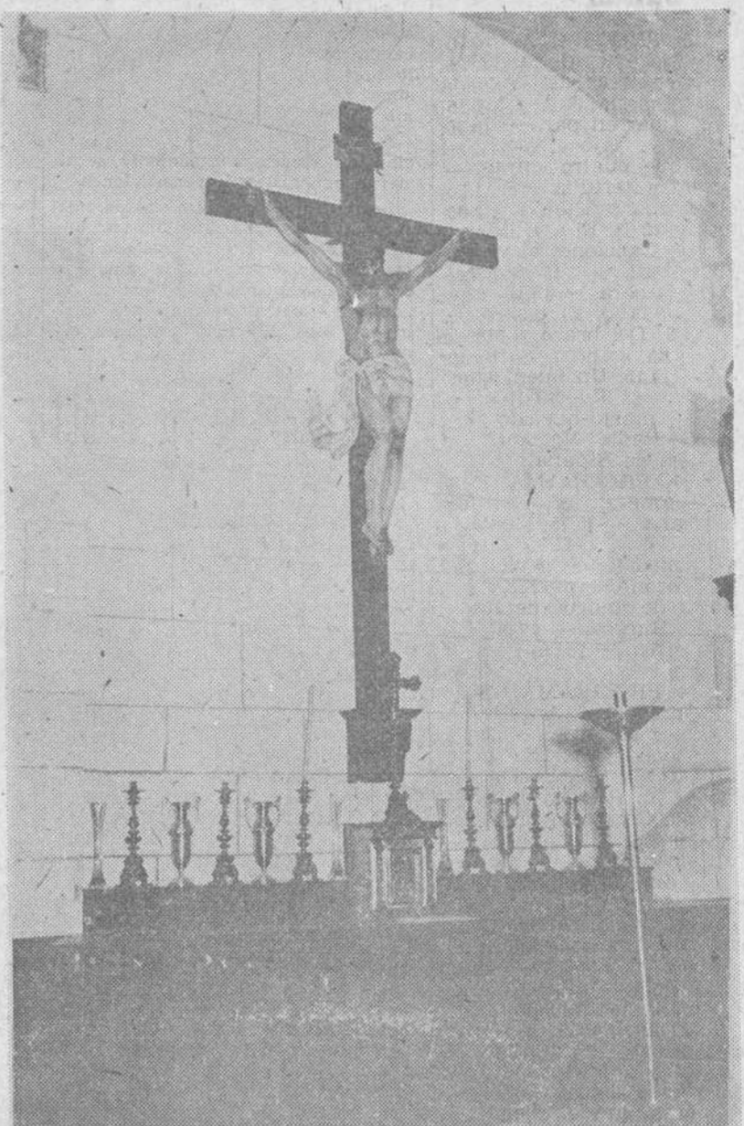
El parainfante del Instituto se ha convertido en capilla. Para ser más exactos, ha vuelto esta a su primitivo lugar donde estuvo emplazada en tiempos del histórico colegio de San Nicolás. El grabado reproduce un primer plano del altar mayor, tal y como aparece provisionalmente.

«¿Secciones filiales en el sector del ansanche de Burgos, y dos Colegios menores en nuestro Instituto matriz. Como usted sabe, estos colegios tienen la finalidad de dar albergue, en régimen de internado, a los estudiantes forasteros. A nosotros nos vendría de maravilla a fin de acoger a los que nos llegan de la provincia. Las necesidades de Burgos en el orden docente, se recordaron en la