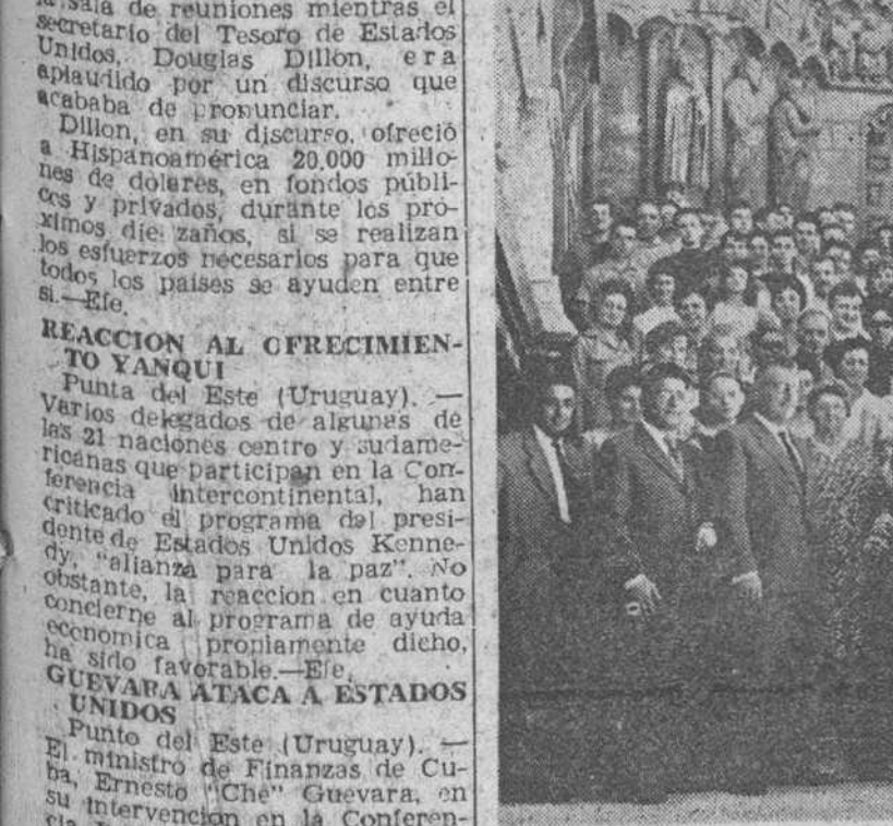
En el programa de vistas previstas por los Cursos de Verano figura, naturalmente, en primer término la de la Catedral, cuya riqueza artística y monumental ha sido admirada por todos los alumnos durante su recorrido por el S.T.M. — A la salida del templo catedralicio, «Pedes» ha obtenido la precedente plaza.