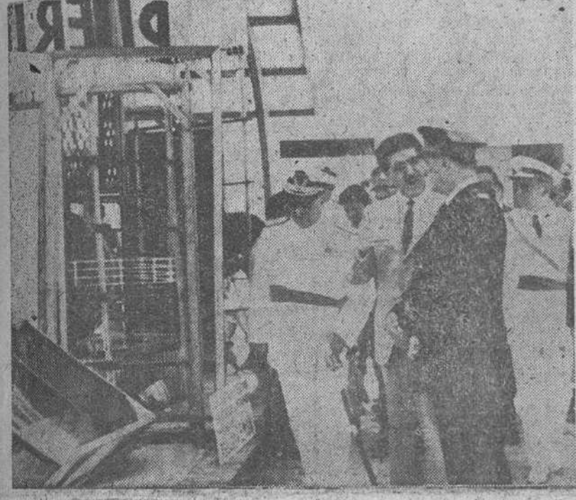
El Ferrol del Caudillo. — El ministro de Información y Turismo, Sr. Arias Salgado, recorre las instalaciones de la Feria del Mar en la ceremonia inaugural, acompañado de las autoridades.