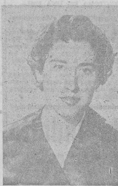
LA DOCTORA LINARES

Conviene saber que ser colaboradora en «Investigaciones Científicas» es una de las metas