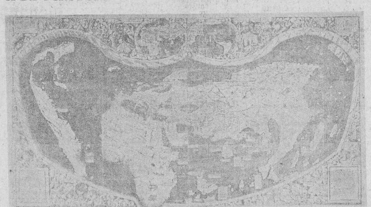
MAPA UNIVERSAL DE 1507, PRIMERO CON EL NOMBRE DE AMERICA. — REPRODUCCION REDUCIDA POR CARLOS SANZ

Don Carlos Sanz ha transcrito y reconstruido, con profusión de notas críticas y comentarios, el texto original español, de la famosa Carta de Colón" (15 de Febrero 14 de Marzo de 1493), impresa en Barcelona por Pedro Pousa en 1493.