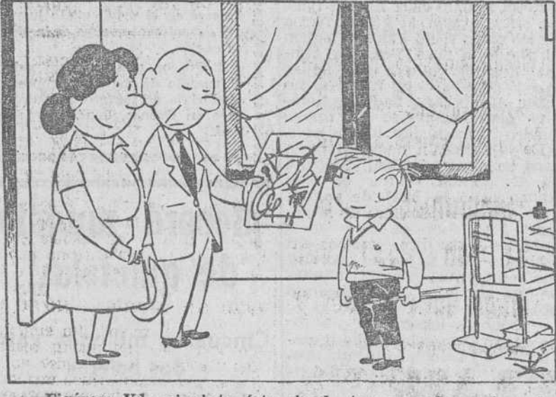
—Figúrese Vd.; si pinta esto siendo tan pequeño, qué no hará cuando sea mayor.