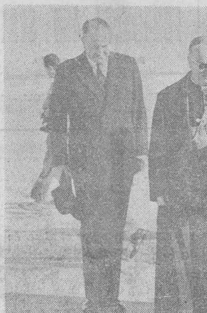
El Cardenal Ottaviani en Madrid

la conferencia anual del partido conservador, que dio su total aprobación a la política exterior del Gobierno, de mantener la libertad y viabilidad de Berlín occidental y los derechos y obligaciones de Occidente, mientras se busca un arreglo con la URSS. Pide la colaboración estrecha con la Commonwealth y el resto de Occidente y reafirma su apoyo a los principios de la ONU.