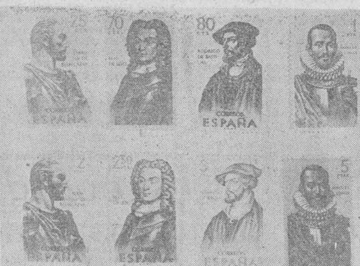
NEUVOS SELLOS DE CORREOS.—He aquí la serie de valores postales denominada «Personajes y descubridores de América», que serán puestos en circulación y a la venta el próximo día 31 para realizar y enaltecer las grandes figuras de la historia de América.

Por Blas PIÑAR LOPEZ (Director del Instituto de Cultura Hispánica)