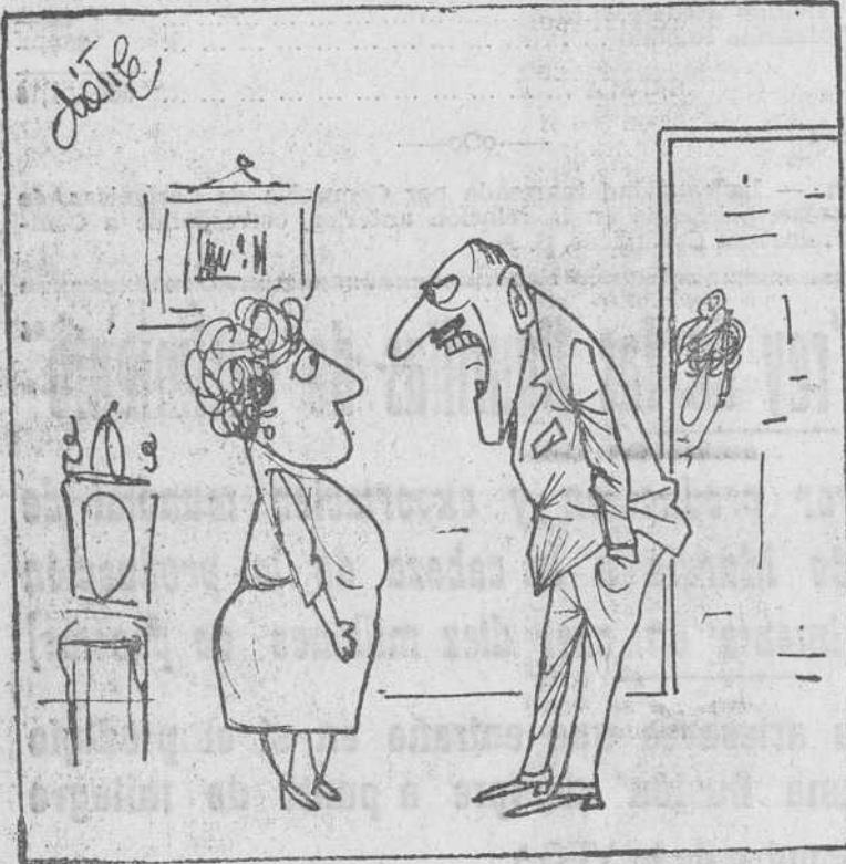
—Lo que es inadmisibile es que tu madre les escriba una carta a los Reyes Magos y luego me la eche a mi por debajo de la puerta!