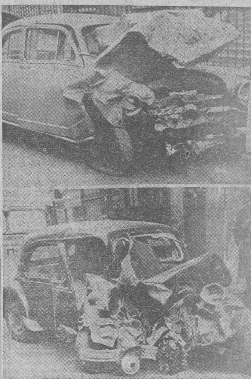
París. — Ocho heridos graves resultaron de la colisión de un «Aronde» contra un «Citroen» en los que viajaban varios de los asistentes al «Agape de Nochebuena de Bois de Boulogne». En la foto, estado de los coches después del accidente.

Ocho heridos graves en el accidente del «Agape de Nochebuena de Bois de Boulogne»