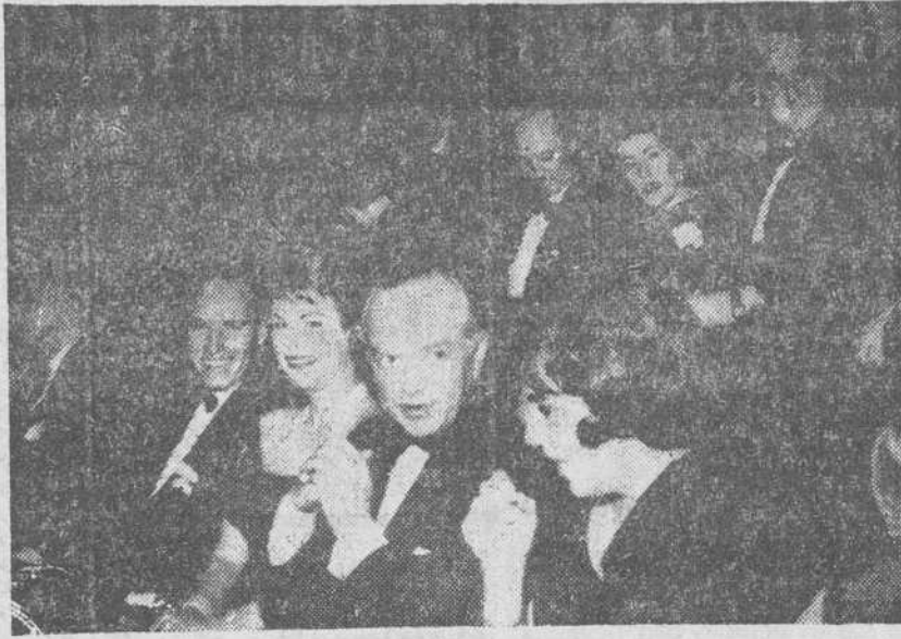
Chariton Heston, en el Cine Capitol, durante la sesión de gala en que se estrenó «El Cid».

Para la creación del guión de «El Cid», Phillip Yordan y Frederic M. Frank se han nutrido de numerosos elementos históricos, literarios, tradicionales, todos ellos esenciales. Con tal variedad se ha conservado fidedignamente lo primordial, se ha enriquecido documentalmente lo secundario y se ha dotado de movilidad al guión, al ser entrelazadas las acciones de unas fuentes con otras. (La suma de ciertas concesiones y algunos convencionalismos no desmestado graves, son imposiciones, en cierto modo lógicas). En su construcción se ha empleado una técnica de contrastes alternados, emocionalmente eficaz. Y en su desarrollo encontramos el contenido y los elementos de la epopeya: el hombre contra las fuerzas (Rodrigo contra los árabes, las intrigas cortesanas, la incompreensión, la soledad, su carácter violento, el deber); el simbolismo (el hombre héroe, poderoso pero vulnerable, mítico pero humano); retrato rápido de los tipos, sin demasiada carga psicológica; presencia de la tradición; estructura poética; grandiosidad en el conflicto; solemnidad de ritmo. Conservándose esto, las leves infidelidades históricas del guión se nos antojan nimias.