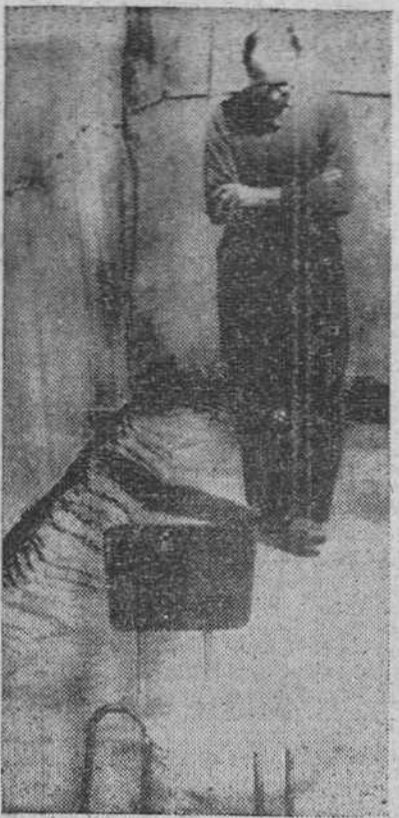
Jerusalén.—Con la cabeza bañada y los brazos cruzados, el ex-líder nazi Adolfo Eichmann hace ejercicio durante su hora de asueto, al aire libre, en la fortaleza de Teggart, cerca de Nazaret.

Por estas fechas, ya funcionaban campos de concentración en la Alemania nazi, para los enemigos del régimen, entre los cuales figuraba una gran cantidad de