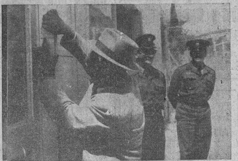
Adolf Eichmann va a ser juzgado en un edificio nuevo de Jerusalén, donde han sido tomadas todas las precauciones posibles contra no sabemos qué posibles intentos de fuga o rescate del procesado. En la foto, un funcionario del Ayuntamiento de Jerusalén fija una «enezzuz» a la entrada del tribunal. Esta pequeña placa es un símbolo que los judíos colocan en todos los nuevos edificios.

"La República Federal alemana —dice Adenauer— desea que se conozca la verdad y se haga justicia"