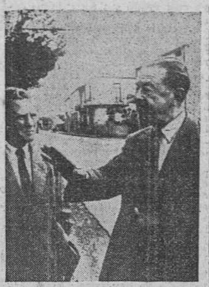
Lord Alexander describiendo la lucha que tuvo lugar en las afueras de Salerno. A la izquierda, Lord Harding, su jefe de Estado Mayor durante la guerra. En el fondo, un edificio con huellas de la contienda (Octubre de 1960).

La suerte puede jugar un papel muy importante en la guerra, pero prefiero un eficaz Angel de la Guarda como el que me custodió, a pesar de profundas desilusiones y serios obstáculos, durante las operaciones de Salerno, Cassino y Anzio. El objetivo de la operación de Salerno fue la ocupación de un puerto lo más al Norte que fuera posible para que nos sirviera de base firme de aprovisionamiento a fuerzas importantes en el interior. Para ello elegimos Nápoles. Pero como sus defensas eran demasiado fuertes para ser tomadas por asalto desde el mar, buscamos adecuadas playas de desembarco cerca de Nápoles y las de Salerno resultaron ser las mejores por tres razones.