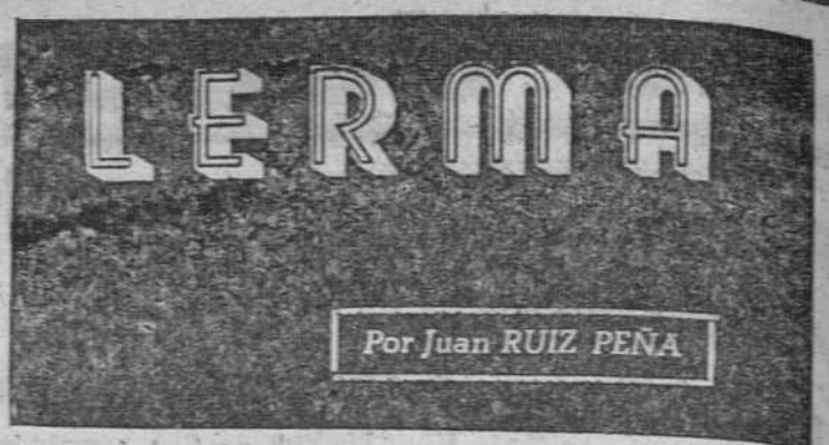
Por Juan RUIZ PEÑA

MAMBRUNO ha llegado a Lerma con varios amigos en automóvil; hace sol pero la mañana de Octubre es bien fría. Se divisa el palacio ducal, sus torres altas y los muros rodeados de chopos amarillos. Lerma es uno de los pueblos más armoniosos de Castilla, por no decir de España. Lerma es toda armonía, música arquitectónica, ritmo pintoresco. Es sumamente difícil hallar un conjunto monumental y urbano tan homogéneo, tan unisónico, en su ritmo artístico, como el de Lerma. Entra Mambruno en Lerma por una puerta arqueada, con dos torreones. La piedra maciza y amarilla le da como un aire medieval de fortaleza. Hacia la izquierda, flanqueada la entrada asciende la calle del Reventón. Hay en ella una casa con porche, y en una ventana, macetas con geranos rojos. De pronto, un ángulo de sombra y surge una casa con balcones verdes, hacia el centro la mole roja de un convento. Sombrea la piedra conventual unos arbolitos con hojas verde-amarillas. Se alza la espadaña del convento hacia la calle Mayor que serpentea airosa y vital Mambruno y sus amigos van al azar por las calles de Lerma. Así la calle del Barquillo, la plaza del Mercado Viejo y una plazoleta que Mambruno denomina del cacique.