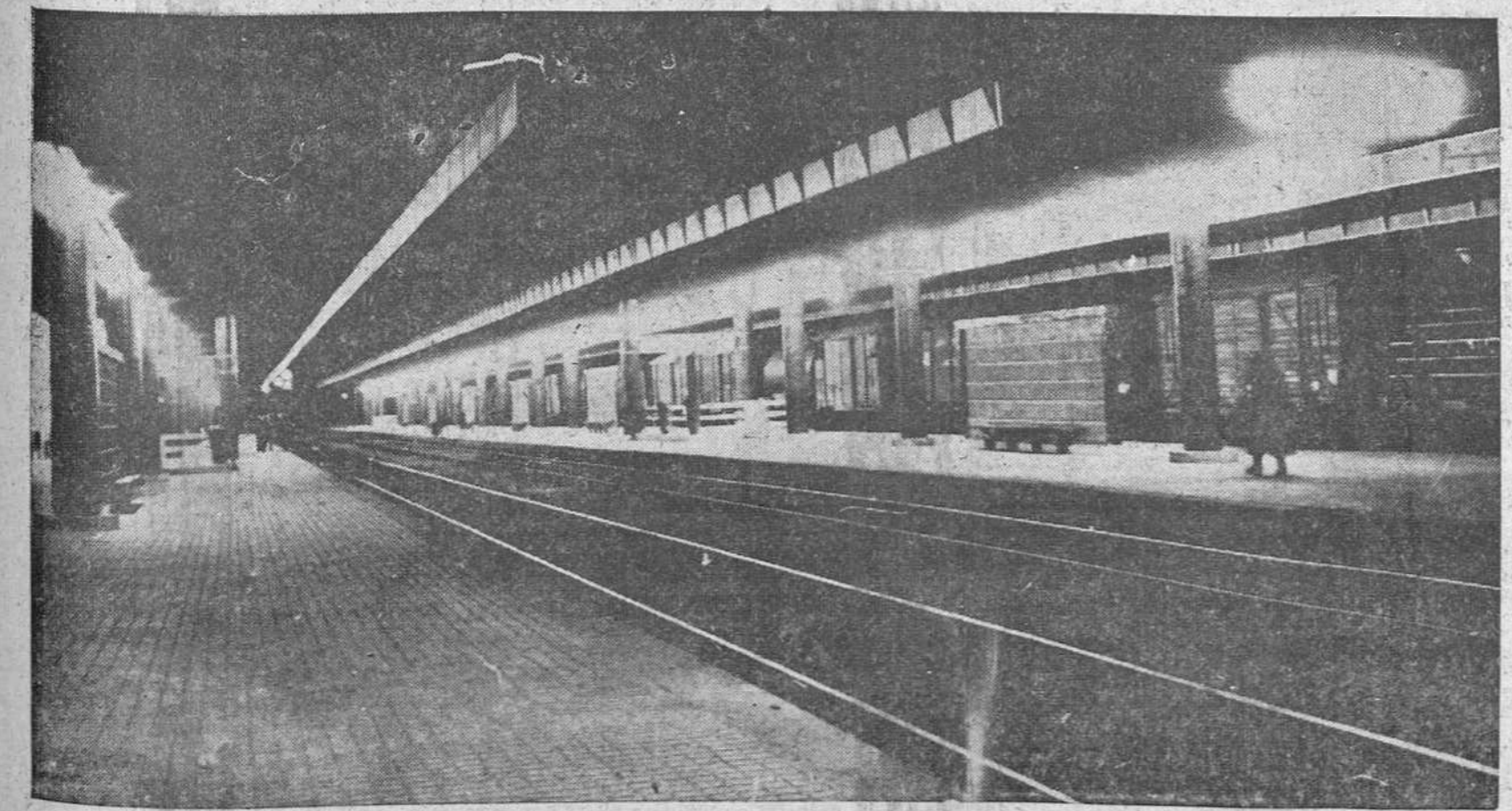
Ayer se hizo cargo oficialmente el Ministerio de Obras Públicas y — para su explotación — la RENFE, de la nueva «Estación común» de Burgos, una vez llevado felizmente a cabo el proyecto de mejora y ampliación de la primitiva, en cuyos trabajos se invirtieron cerca de 84 millones de pesetas.

Nuestro redactor gráfico obtuvo anoche la precedente placa que reproduce una perspectiva de algunos de los andenes y vías tal y como aparecen iluminados por medio de tubos fluorescentes y potentes lámparas de vapor de mercurio.