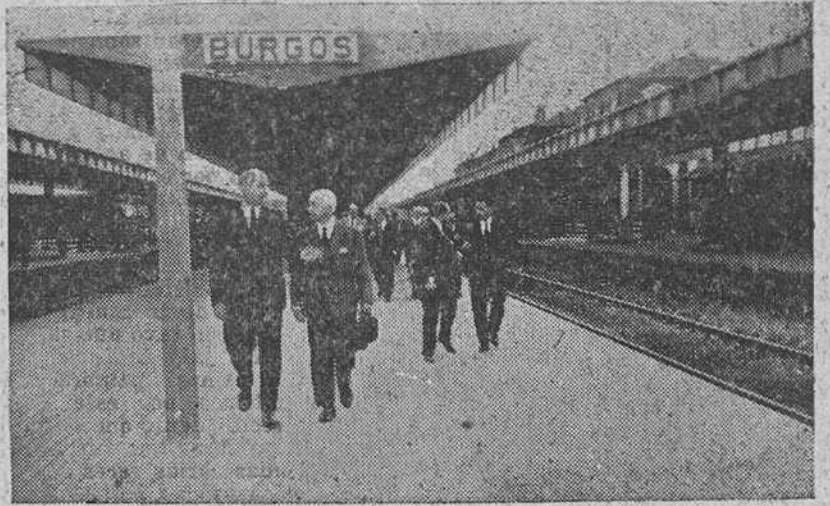
En el grabado superior, momento en que se formalizaron los documentos de entrega y recepción oficial de la obra, ya concluida, de la "Estación común" de Burgos. Previamente las personalidades y técnicos de Obras Públicas, de la RENFE y de la empresa constructora efectuaron una inspección a las instalaciones y servicios, cuya visita recoge la imagen inferior.