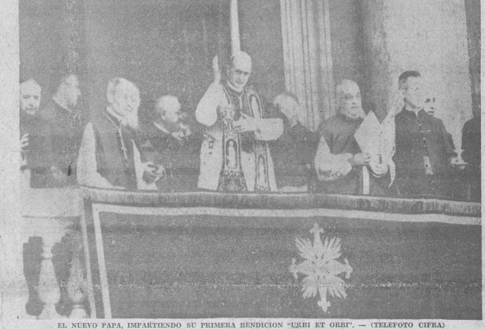
EL NUEVO PAPA, IMPARTIENDO SU PRIMERA BENDICION «URBI ET ORBI».

CIUDAD DEL VATICANO. HA SIDO ELEGIDO PAPA EL CARDENAL ARZOBISPO DE MILAN, JUAN BAPTISTA MONTINI. EL NUEVO PAPA HACE EL NUMERO 263 DE LA HISTORIA DE LA CRISTIANDAD. REINARA CON EL NOMBRE DE PABLO VI. EL ANUNCIO DEL NUEVO PAPA, HECHO EN LATIN POR EL CARDENAL ALFREDO OTTAVIANI, DECANO DE LOS CARDENALES DIACONOS, DESDE EL BALCON PRINCIPAL DE PALACIO VATICANO, FUE EL SIGUIENTE: “OS ANUNCIO LA MAGNA NOTICIA. TENEMOS PAPA: EL EMINENTISIMO SENOR CARDENAL GIOVANNI BATTISTA MONTINI.”