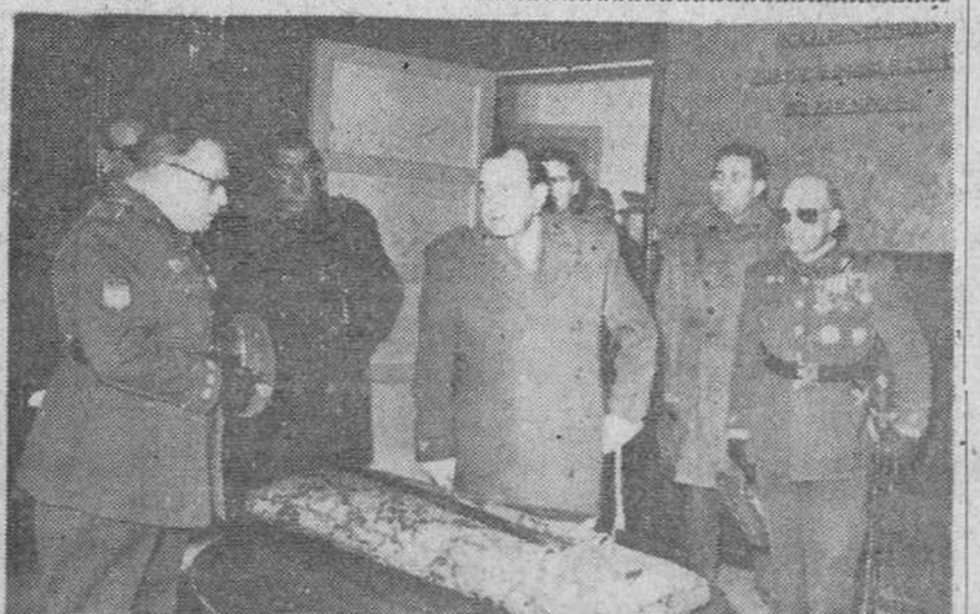
de oficiales.