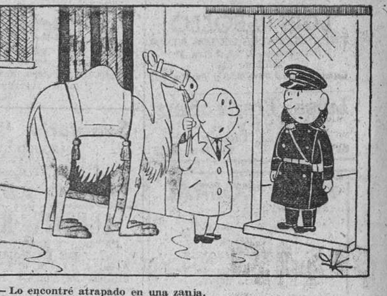
—Lo encontré atrapado en una zanja.