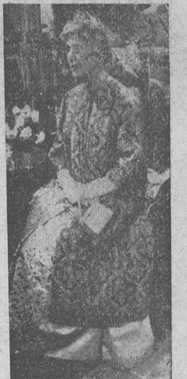
Lausana (Suiza). — La ex-Reina de España Doña Victoria Eugenia ha celebrado hoy en la intimidad su setenta y seis cumpleaños. Nació en el castillo de Balmoral (Inglaterra), la ex-Sobrana española, viuda del Rey Don Alfonso XIII, es nieta de la Reina Victoria de Inglaterra.