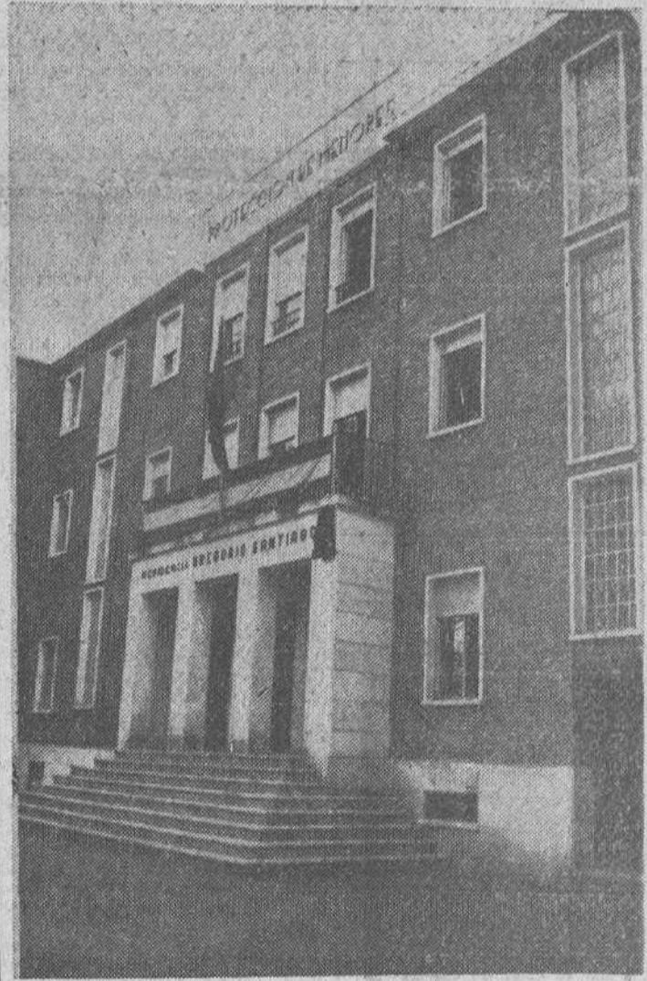
Con gran solemnidad, se efectuó ayer la solemne bendición e inauguración de la magnífica residencia «Gregorio Santiago y Castiella» para Menores, de cuyos actos damos cuenta en tercera página. — En la precedente placa, perspectiva de la fachada principal del edificio.