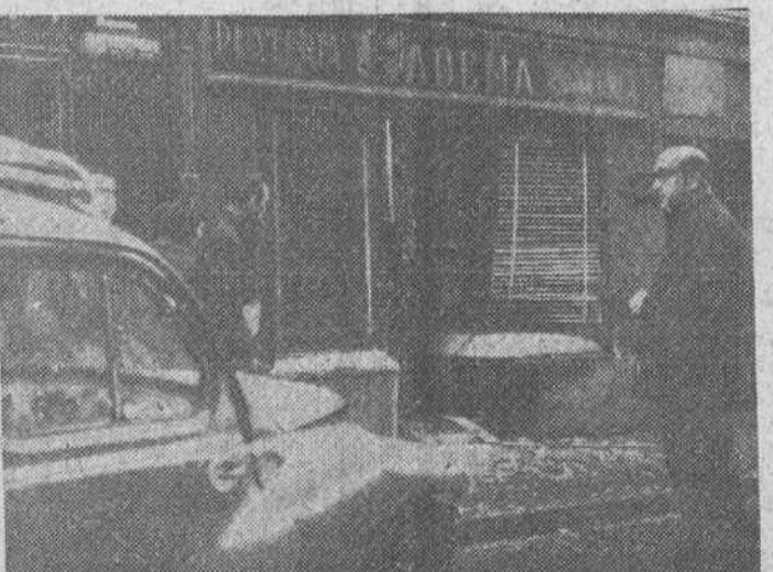
En la mañana de ayer, un coche se precipitó contra el escaparate de un establecimiento comercial de la calle de la Paloma, en su zona más angosta. He aquí cómo quedó dicho escaparate, después del accidente.