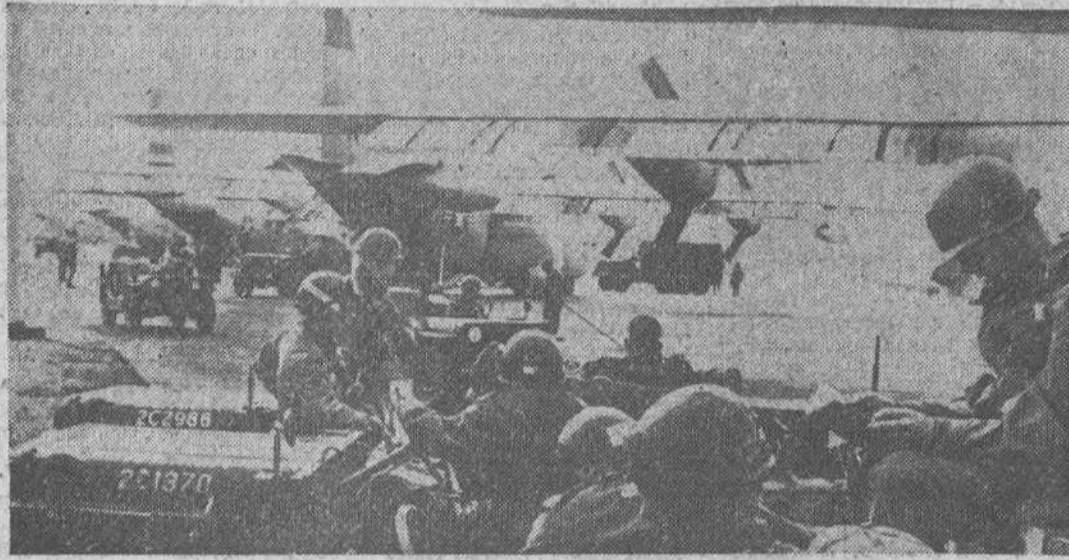
En tres días el personal y el material ligero de la segunda división acorazada de los Estados Unidos está siendo transportada a través del Atlántico de Texas a Frankfurt para participar en la mayor maniobra aerotransportada de la Historia. En la foto los conductores de los «jeeps» esperan el momento de embarcar a bordo de los gigantes aviones, de transportes «Hércules», rumbo a Europa, en una base de Texas.

A través del cielo del Atlántico... en jeep