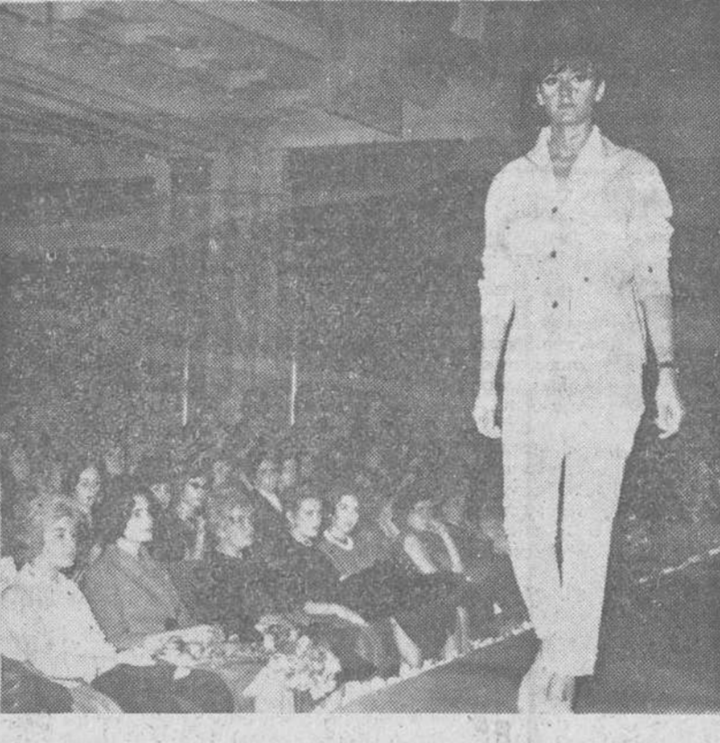
Un momento del brillantísimo desfile de modelos, ofrecido en la tarde de ayer por la firma "MATEOS", concesionaria de la Casa "MARIE CLAIRE" y que se vió realzada con la presencia de S. A. R. la Infanta María Teresa de Borbón Parma, que aparece en el grabado, en primera fila (segunda de izquierda a derecha)

Si otro vehículo ha de adelantarse al tuyo, facilítale su maniobra. No "hagas carreras". Modera tu velocidad. Guarda tu derecha. Haz con el intermitente o con la mano la señal para que pase o para que coozca un peligro que solo tú puedes observar.