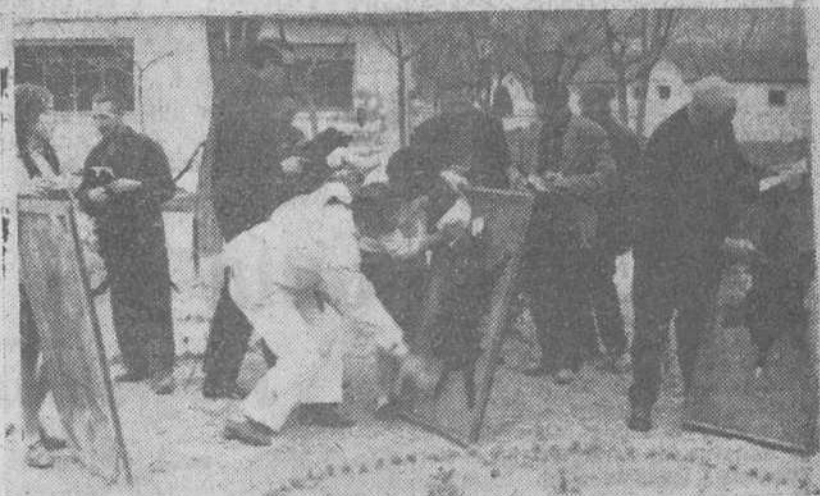
Selección de pieles de ganado karakul en el Centro de Ciudad Real.

Solo falta que alguien se proponga cristalizar el proyecto en realidad pronta y feliz, porque esta industria en ciernes, sería interesantísima y de una buena importancia económica. Sobre la carne, sobre la leche y el queso, sobre las pieles de astrakán — que tarea tan entretenida y delicada es la de cuidar los moruecos, las ovejas y los corderos nacidos o nonatos, trabajar las pieles, clasificar, etc. — que ya suponen un índice de riqueza considerable, he aquí que la lana de karakul sería un estupendo remate para esta amplia y cada día más extendida explotación.