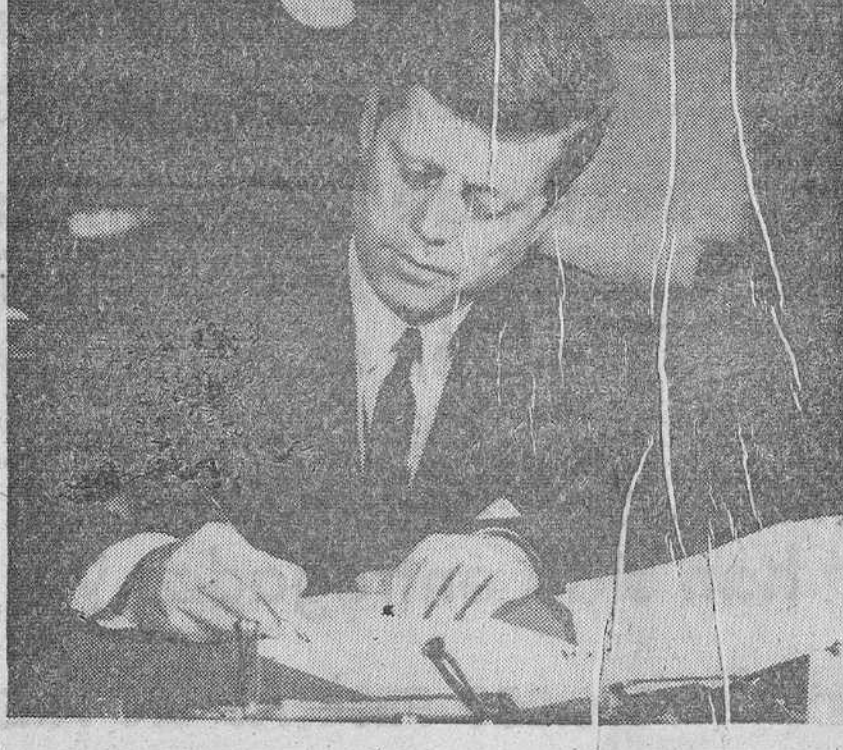
El presidente Kennedy en su despacho oficial de la Casa Blanca. Como se sabe, Kennedy es partidario del pronto ingreso de España en el Acuerdo General del Comercio y Tarifas Aduaneras.

España será considerada como miembro del G. A. T. T. por los Estados Unidos y nuestro país puede ingresar en el mismo en el curso de este año