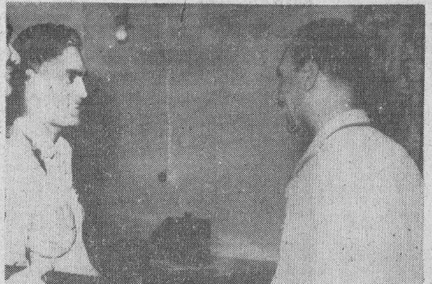
Una fotografía histórica

Bagdad.—Esta fotografía, de archivo, pertenece ya a la historia. En ella aparece, a la izquierda, el general Kassem, el depuesto y asesinado presidente del Iraq, con el coronel Abdel Salem Aref, dirigente del movimiento y actual presidente. Fue obtenida en 1958, después del golpe de Estado que llevó a Kassem a la jefatura del Iraq y en el que el coronel Salem fue uno de sus más directos colaboradores.