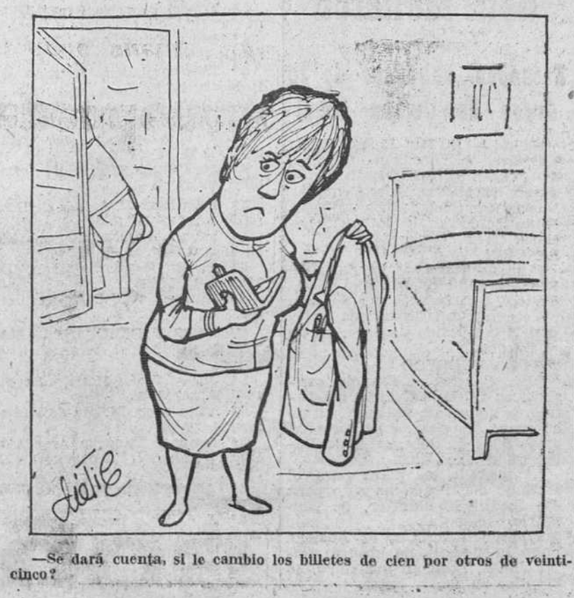
—Se dará cuenta, si le cambio los billetes de cien por otros de veinticinco?