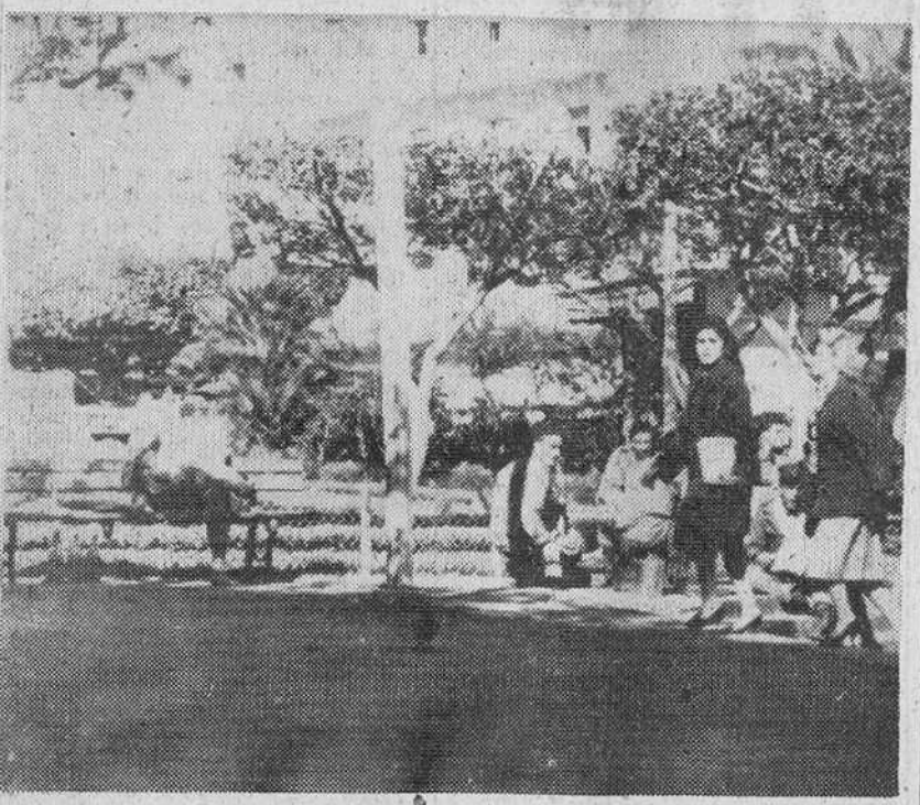
¿Dónde fueron a parar aquellas mocitas alegres, dicharacheras, tacon alto y traje estampado de vivos colores? Hoy, la calle Bouzeerah ya no ofrece este aspecto.