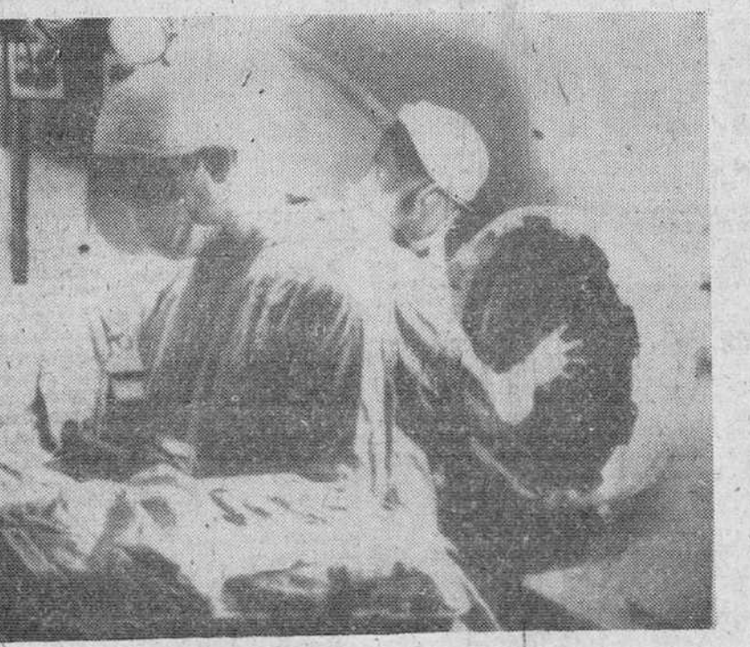
Para los «niños azules»

Se cree que unas 200.000 personas han tenido que buscar refugio en la selva. Las ciudades y pueblos de la región se encuentran desiertos. Ocho jefes de tribu, que eran fieles al Gobierno central, han desaparecido cuando los rebeldes iniciaron sus ataques. Se teme que hayan sido asesinados y devorados por sus enemigos.—Efe.