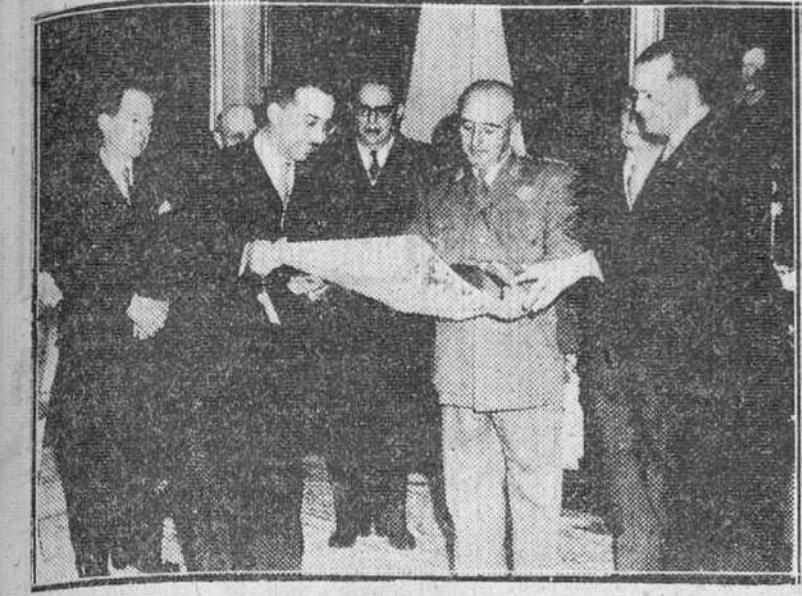
MADRID. -- ACOMPAÑADOS DEL MINISTRO DE LA GOBERNACION SENOR PEREZ GONZALEZ Y DEL DIRECTOR GENERAL DE COMUNICACIONES, SENOR RODRIGUEZ DE MIGUEL, LOS CONGRESISTAS QUE HAN TOMADO PARTE EN LAS REUNIONES DE LA UNION POSTAL DE LAS AMERICAS Y ESPAÑA, ACUDIERON AL PALACIO DE EL PARDO DONDE FUERON RECIBIDOS POR SU EXCELENCIA EL JEFE DEL ESTADO.