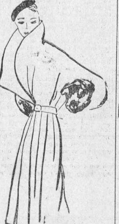
Abrijo de paño crema, con puños de piel de Leopardo (Creación de Cristian Dior)

Así que, con mis excusas, me permito enviarles esta film de corto metraje, captado al azar de un paseo matinal a través de las calles de París.