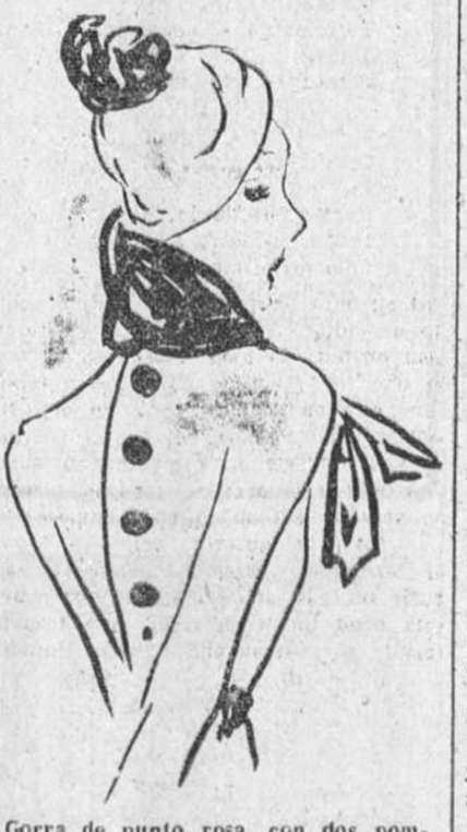
Gorra de punto rosa, con dos pompones de nutria. (Creación Teresa Fotter)

Delante de las vitrinas de otro célebre modisto, una elegante, envuelta en una "echarpe" escocesa, contempla con interés un abrigo de lana con pelo largo, color de arena, adornado con cuello y puños de opossum. Lo que prueba que muy a menudo, estas tiendas de fantasía cada vez más de moda en París, pueden luchar contra las casacas de "Alta Costura". Digamos de paso