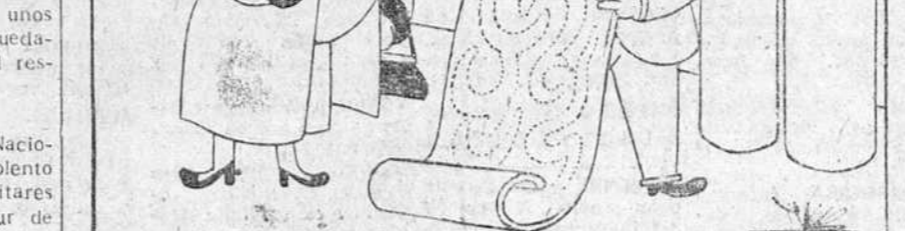
—Si, esta alfombra me gusta. ¿Quiere Ud cortarme un trozo como muestra, para que lo vea mi marido?