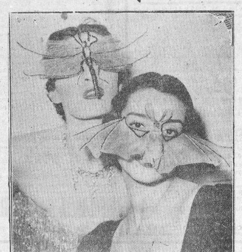
Junto con esta fotografía, recibimos el siguiente pie:

Lisboa.—En la Asamblea Nacional ha comenzado la discusión del presupuesto del Estado para 1951. Se limitan al mínimo las compras y los viajes oficiales al extranjero, así como otros gastos, cuidándose de no aumentar los cuadros y escalafones de funcionarios públicos.—Efe.