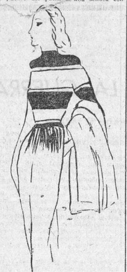
Para el "yachting", conjunto de chaqueta y pantalón de franela blanca, con "pull over" rayado de blanco y azul marino.

y confortable. Huyamos de las "toilettes" de tipo de opereta y de "do aquello que no sea estrictamente náutico. Nada más ridículo que ver aparecer en el puente del yacht a una señora con