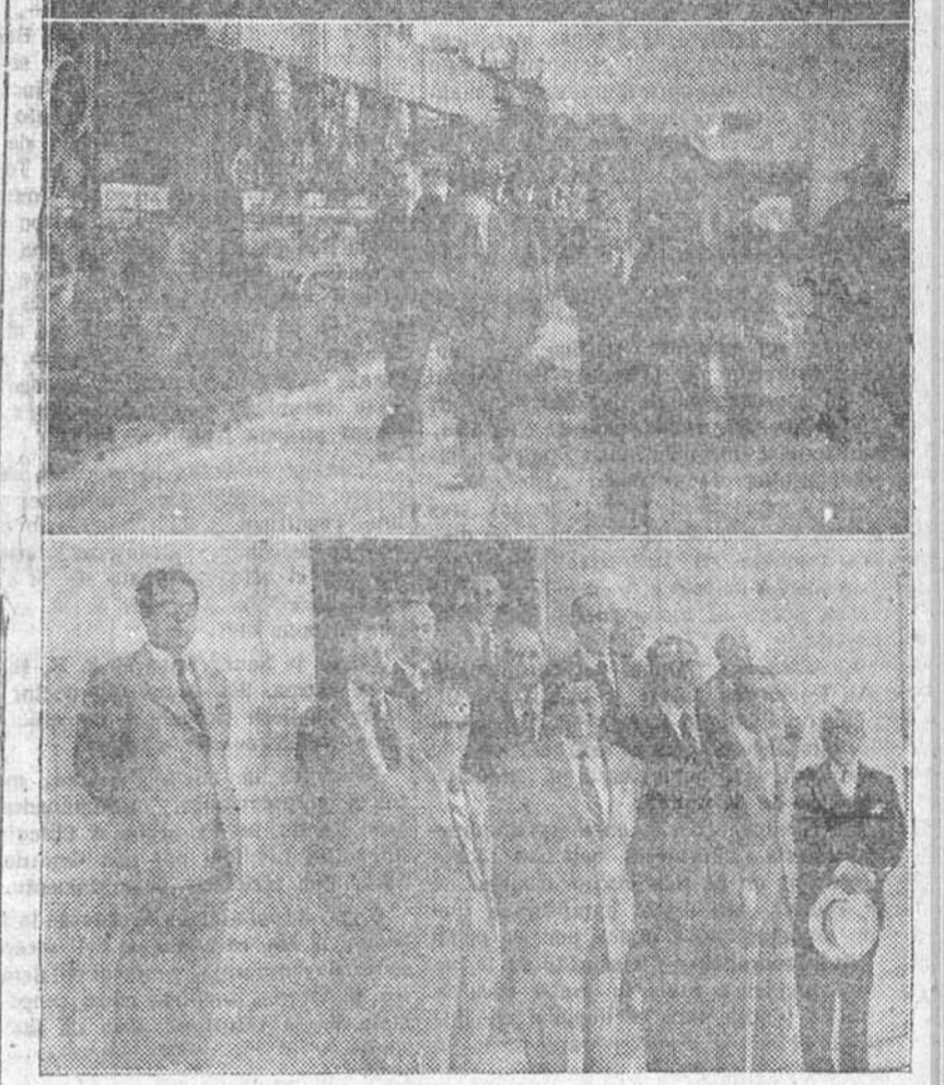
En nuestras fotografías aparecen: una perspectiva de la nueva fábrica de la Moneda, un momento de la visita efectuada a sus instalaciones por los miembros de su Consejo de Administración y un grupo de éstos a la salida de la fábrica.