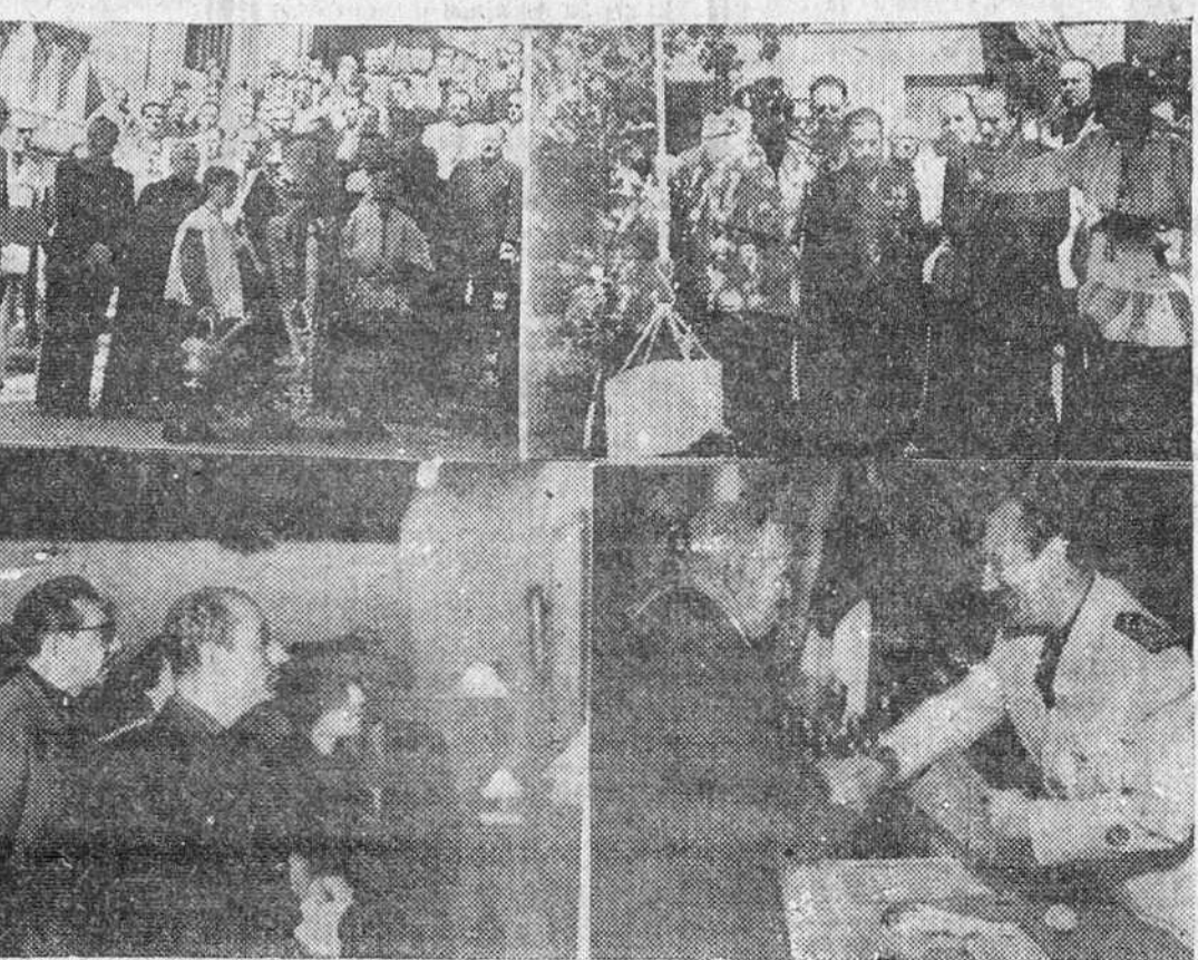
REPORTAJE GRAFICO DE "Fede" SOBRE LOS BRILLANTES ACTOS CELEBRADOS AYER EN NUESTRA CIUDAD, CON MOTIVO DE LA "FIESTA DE EXALTACION DEL TRABAJO"