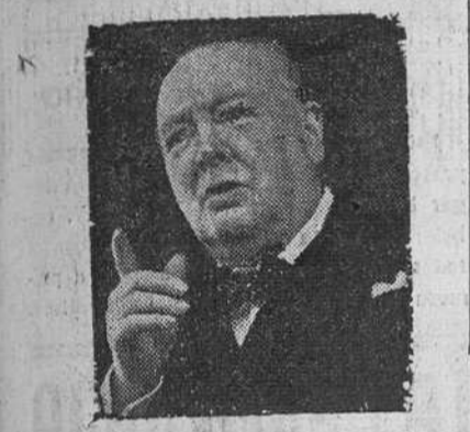
Londres.—Winston Churchill, ha salido en avión con dirección a Londres, para dirigir la campaña electoral del partido conservador.

Los laboristas iniciarán la campaña electoral el próximo 3 de Febrero, en que será disuelto el Parlamento inglés