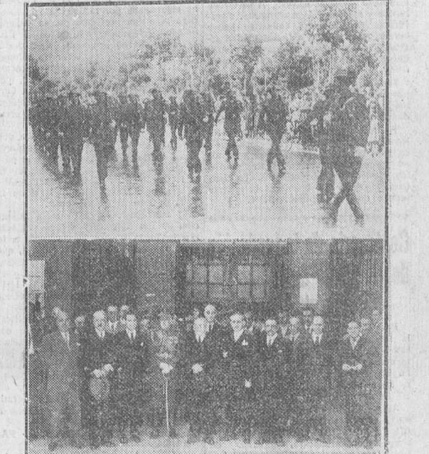
LAS FUERZAS DEL BENEMERITO INSTITUTO DE LA GUARDIA CIVIL, DESFILANDO ANTE LAS AUTORIDADES, DESPUES DE LA SOLEMNE MISA CELEBRADA EN LA IGLESIA DE LA MERCED. EN EL OTRO GRABADO, AUTORIDADES Y REPRESENTACIONES OFICIALES CONCURRENTES A LA CEREMONIA RELIGIOSA CON QUE EL CUERPO DE CORREOS HONRO LA FESTIVIDAD DE SU EXCELSA PATRONA.