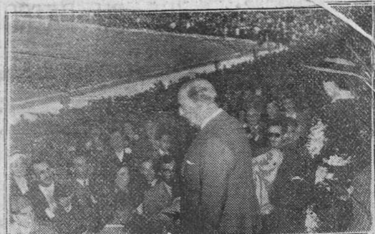
MADRID. — S. E. EL JEFE DEL ESTADO, CORRESPONDE A LAS ACLAMACIONES DEL PUBLICO DESDE EL PALCO DEL ESTADIO DE CHAMARTIN, A SU LLEGADA A ESTE PARA PRESENCIAR EL PARTIDO FINAL DE LA COPA.

Después de un emocionante partido, que precisó prórroga, venció al Real Valladolid, por 4-1