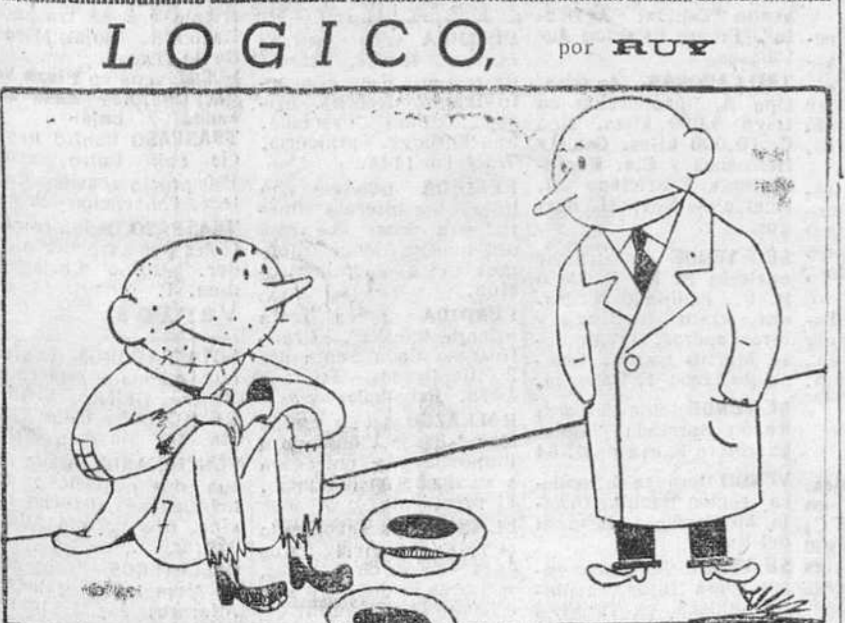
—¿Cómo es que pide limosna con dos sombreros? —Muy sencillo; antes pedía sólo con uno, pero...

Un alto funcionario norteamericano, declaró a la United Press que España siempre ha pagado bien todos sus compromisos. Luego subrayó que la ECA ha informado al Banco de Exportación e Importación en el sentido de que esta entidad debe conceder a España el mismo trato que a cualquier otra nación. —Efe.