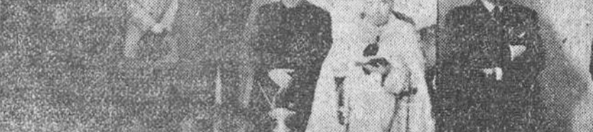
AYER SE VERIFICO LA BENDICION E INAUGURACION OFICIAL DE LAS NUEVAS DEPENDENCIAS DEL JUZGADO MUNICIPAL EN NUESTRO GRABADO, ILLUSTRISIMO SEÑOR SUBDIRECTOR GENERAL DEL RAMO, EN EL CENTRO, DURANTE SU DISCURSO.