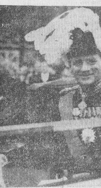
Los Reyes de Dinamarca en París.

Paris. — El Rey Federico de Dinamarca, a su llegada a la capital francesa, recorre las calles acompañado por el presidente Auric.