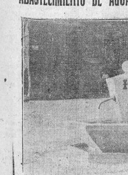
VISTA DE LA FUENTE PÚBLICA CONSTRUIDA POR LA JUNTA TÉCNICA DE LA FALANGE EN EL PUEBLECITO DE VILLANUEVA DE ODRÁ Y QUE FUE INAUGURADA EL JUEVES ÚLTIMO POR EL EXCMO. SR. GOBERNADOR CIVIL Y JEFE PROVINCIAL DEL MOVIMIENTO. CON ESTAS OBRAS SE HA SOLUCIONADO EL ANTIGUO PROBLEMA DEL ABASTECIMIENTO DE AGUAS A AQUELLA LOCALIDAD BURGALESA.