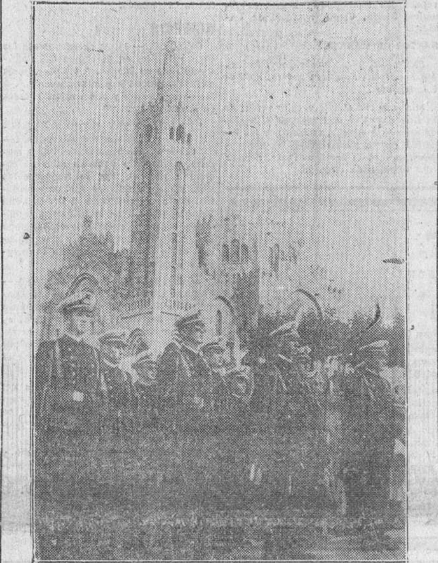
VIGO.—FUERZAS DE LA MARINA FORMADAS ANTE EL TEMPLO VOTIVO DE PANJON DONDE SE CELEBRA LA TRADICIONAL OFRENDA DEL MAR, QUE REVISTO EXTRAORDINARIA SOLEMNIDAD. DICHA OFRENDA FUE HECHA POR EL CAPITAN GENERAL DEL DEPARTAMENTO MARITIMO DEL FERROL DEL CAUDILLO, ALMIRANTE MORENO, Y ASISTIERON NUMEROSAS Y DESTACADAS PERSONALIDADES.