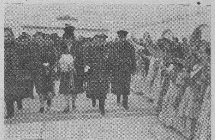
El Generalísimo acompañado de su esposa, del ministro secretario, de Pilar Primo de Rivera y de otras personalidades, inaugura dos nuevos centros de Auxilio Social con ocasión de su VIII aniversario