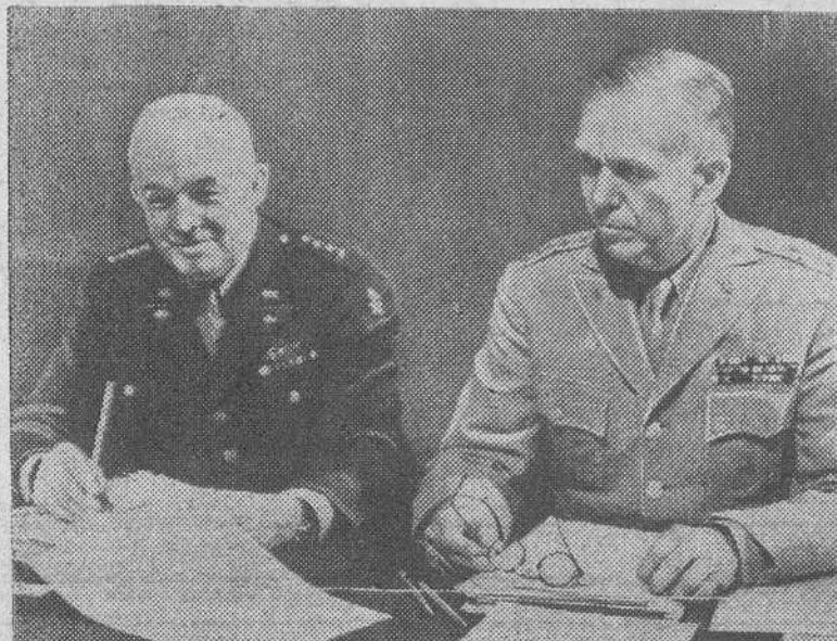
Los generales norteamericanos Marshall y Arnold, en una entrevista recientemente celebrada para tratar de los planes de invasión de Europa