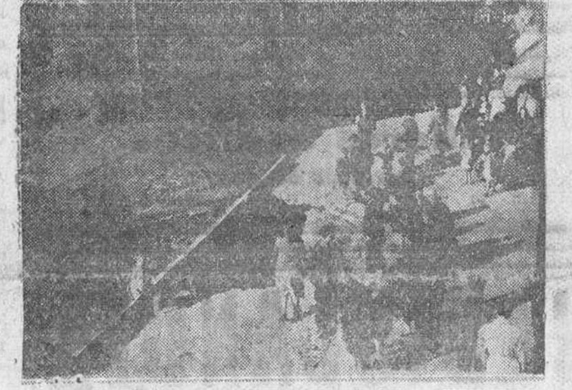
Nuevos socavones del pavimento en la capital de España. El pavimento se ha vuelto a hundir, esta vez en la calle de Santa Isabel, donde se produjo un agujero de seis metros de diámetro, a consecuencia del escape de las cámaras de conducción de agua.—(Foto Gil del Espinar).

Monterrey (Méjico).—El tradicional fervor religioso de esta ciudad se ha desbordado con la iniciación del Segundo Congreso Nacional Misionero.