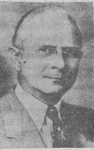
Charles A. Sawyer, secretario de Comercio de los Estados Unidos, que hoy llegará a Madrid, al frente de una misión, para celebrar importantes conversaciones en la capital de España.

INFORME DE LA DELEGACION INDIA Sede de las Naciones Unidas.—La delegación india en la ONU ha facilitado una declaración en la que niega que realmente la China comunista haya rechazado de plano la propuesta nueva india para lograr la paz en Corea.