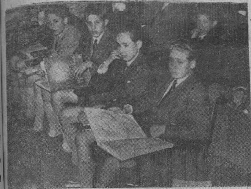
Exámenes del infante Juan Carlos de Borbón. Madrid.—El infante Juan Carlos de Borbón, que aparece en la fotografía en primer lugar, a la derecha, fotografiado en unión de otros compañeros de estudio, durante los exámenes celebrados en el Instituto de San Isidro y en los cuales se sometió a las pruebas finales del curso de Bachillerato.

A la ceremonia asistieron los ministros de Marina, Aire y Secretario general