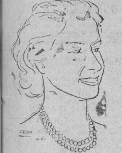
La Reina de Inglaterra celebra su cumpleaños

Ha nombrado Dama de la Corte a la viuda de Bevin