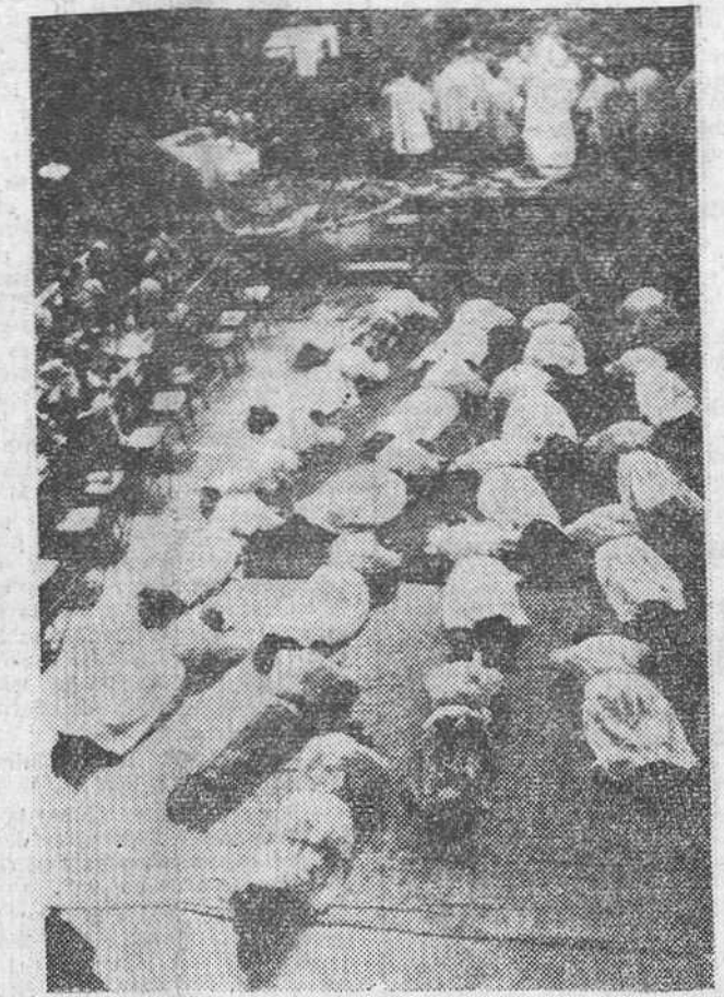
El Excmo. y Rvdmo. Sr. Obispo de Zamora ha efectuado la consagración de varios sacerdotes jesuitas, benedictinos y corazonistas, en el Colegio máximo que la Compañía de Jesús tiene establecido en Oña. En nuestra foto, un momento de la conmovedora ceremonia.