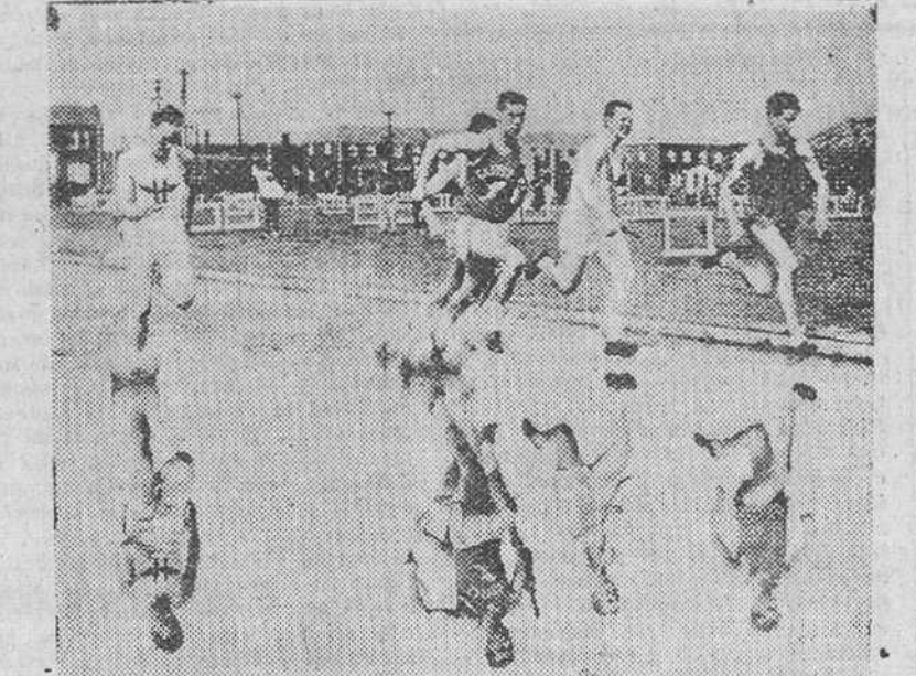
Buena foto! En el curso de una reunión atlética universitaria, celebrada en el estadio Alejandría, de Virginia (E.E. UU.) por los alumnos de la Escuela George Washington, fue obtenida esta instantánea, en la que aparecen cinco de los participantes en una prueba de relevos, salvando una zona encharcada, en la que la cámara ha acertado a recoger fílmicamente el reflejo de las imágenes en el agua.

El Papa termina pidiendo a las Universidades católicas que vuelvan a dedicarse, en estos días difíciles a la misión de fomentar la inteligencia y colaboración internacional más estrecha que sea posible y el más amplio intercambio. — Efe.