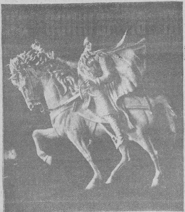
Muchas son las estatuas existentes en el mundo, pero de ninguna se ha hablado tanto ni se suscitado tan apasionados comentarios como la del Cid modelada por Juan Cristóbal para Burgos.