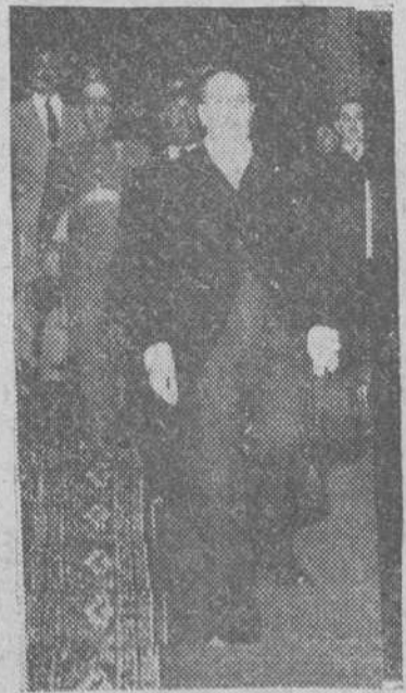
El Cairo. — El señor Martin Artajo acompañado de los miembros de la Misión española, durante la visita realizada al mausoleo del Rey Fuad, en la Mezquita de Rifai, donde depositaron una corona de flores.

Martin Artajo dice que se han concertado acuerdos políticos comerciales y culturales con casi todos los países visitados