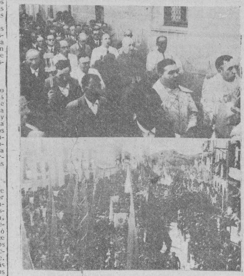
Asamblea Regional Eucarística en Castrojeriz. Dos documentos gráficos de los solemnes actos celebrados el pasado domingo en Castrojeriz, con motivo de clausura de la Asamblea Regional Eucarística celebrada en aquella villa. En la parte superior, el excelentísimo señor Arzobispo, presidiendo la procesión. Abajo, imponente aspecto que otorga la plaza mayor de Castrojeriz a la llegada del cortejo.

Madrid.— El primer Congreso Iberoamericano de Aviación se inaugurará mañana en Madrid. Tienen anunciada su asistencia delegados de Portugal, Brasil, Méjico, Bolivia, Chile, Uruguay, Cuba, Venezuela y Colombia.