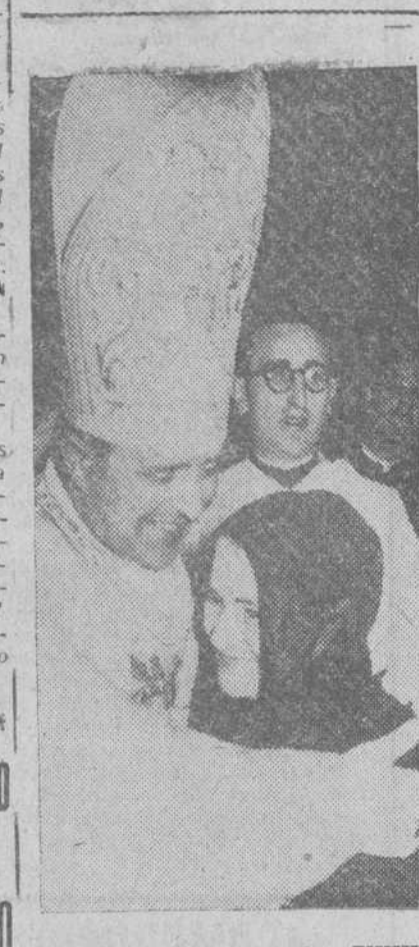
Carrión de los Condes (Palencia). — El nuevo Obispo de Barbastro, doctor Cantero, después de su consagración, efectuada en su pueblo natal, abraza a su madre. Asistieron a la ceremonia los ministros de Información y Turismo, Aire y Obras Públicas; el director general de Prensa y otras personalidades.