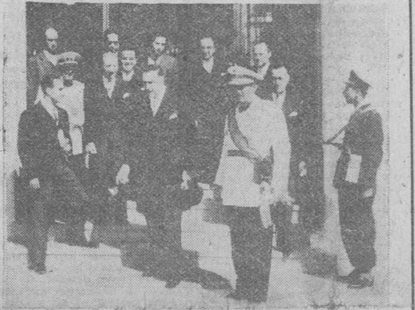
LA MISION ESPAÑOLA EN DAMASCO. — El ministro de Asuntos Exteriores, señor Martín Artajo, acompañado de los miembros de la Misión española a la salida del hotel donde se hospedan, para cumplimentar al Presidente de la República, general Fauri Al-Selo.